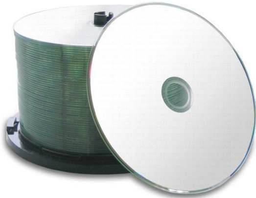
CD 700 M6