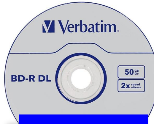
Blue Ray 25 Гб x 2