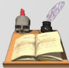
Текст научной книги