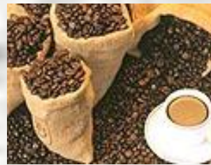
Бразилия являлась поставщиком кофе...