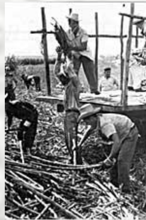
Куба – сахара...