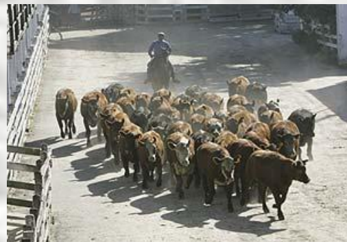
Аргентина – мяса...