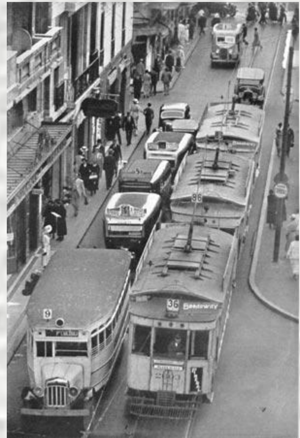
Улица Сармьенте в Буэнос-Айресе