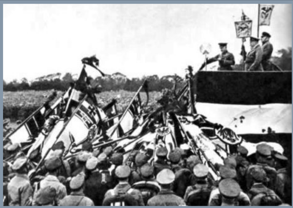
Фашизм в Италии