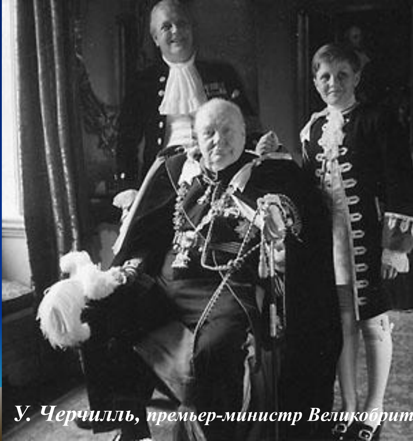
У. Черчилль, премьер-министр Великобритании