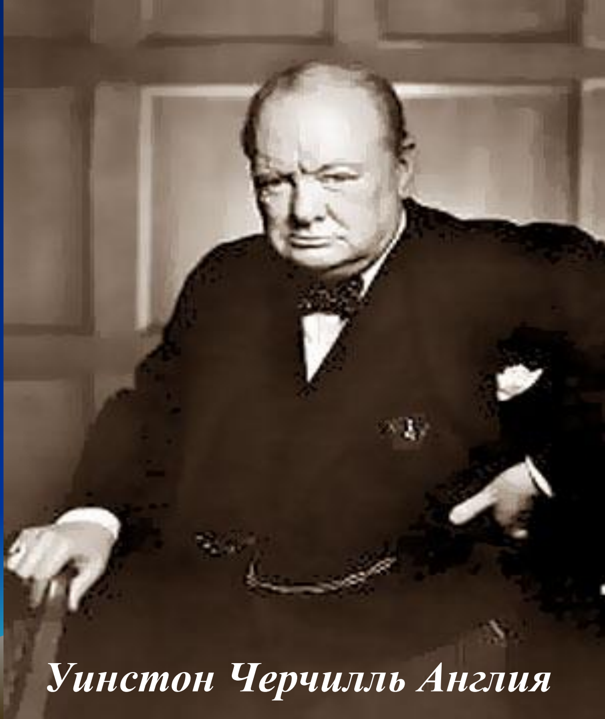
Уинстон Черчилль Англия