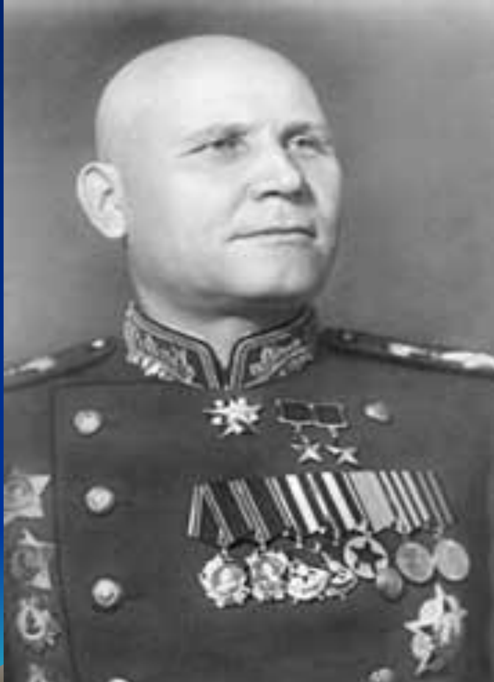
Конев Иван Степанович