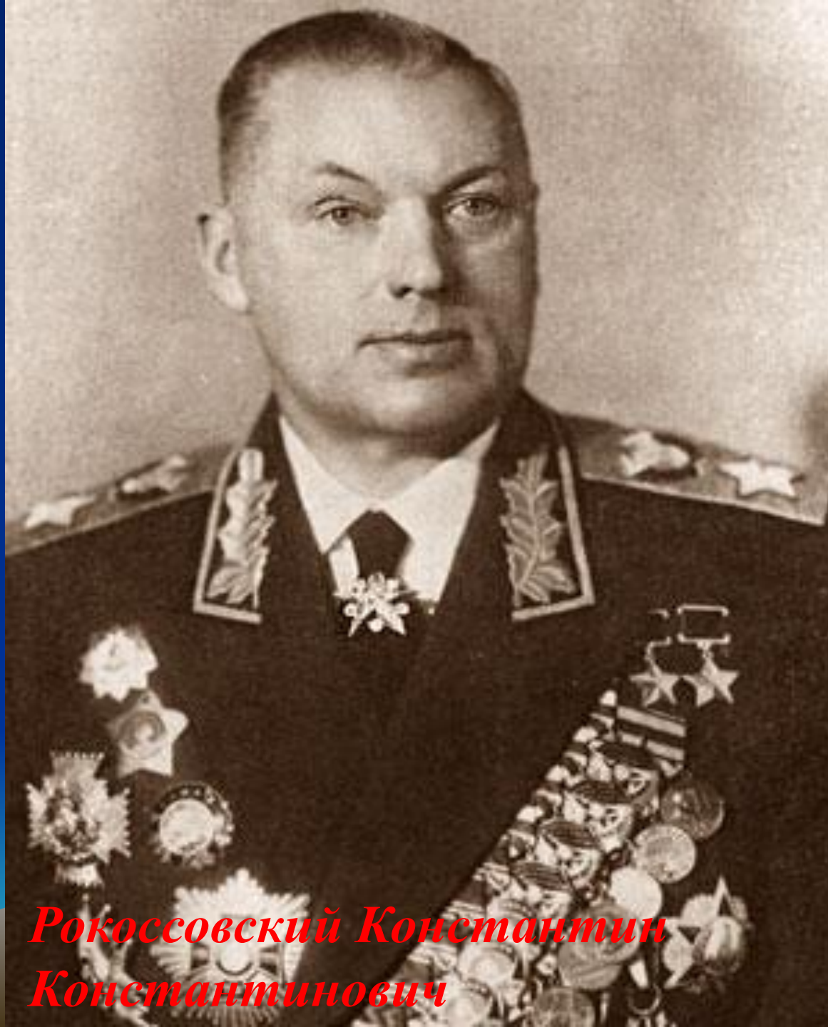
Рокоссовский Константин Константинович