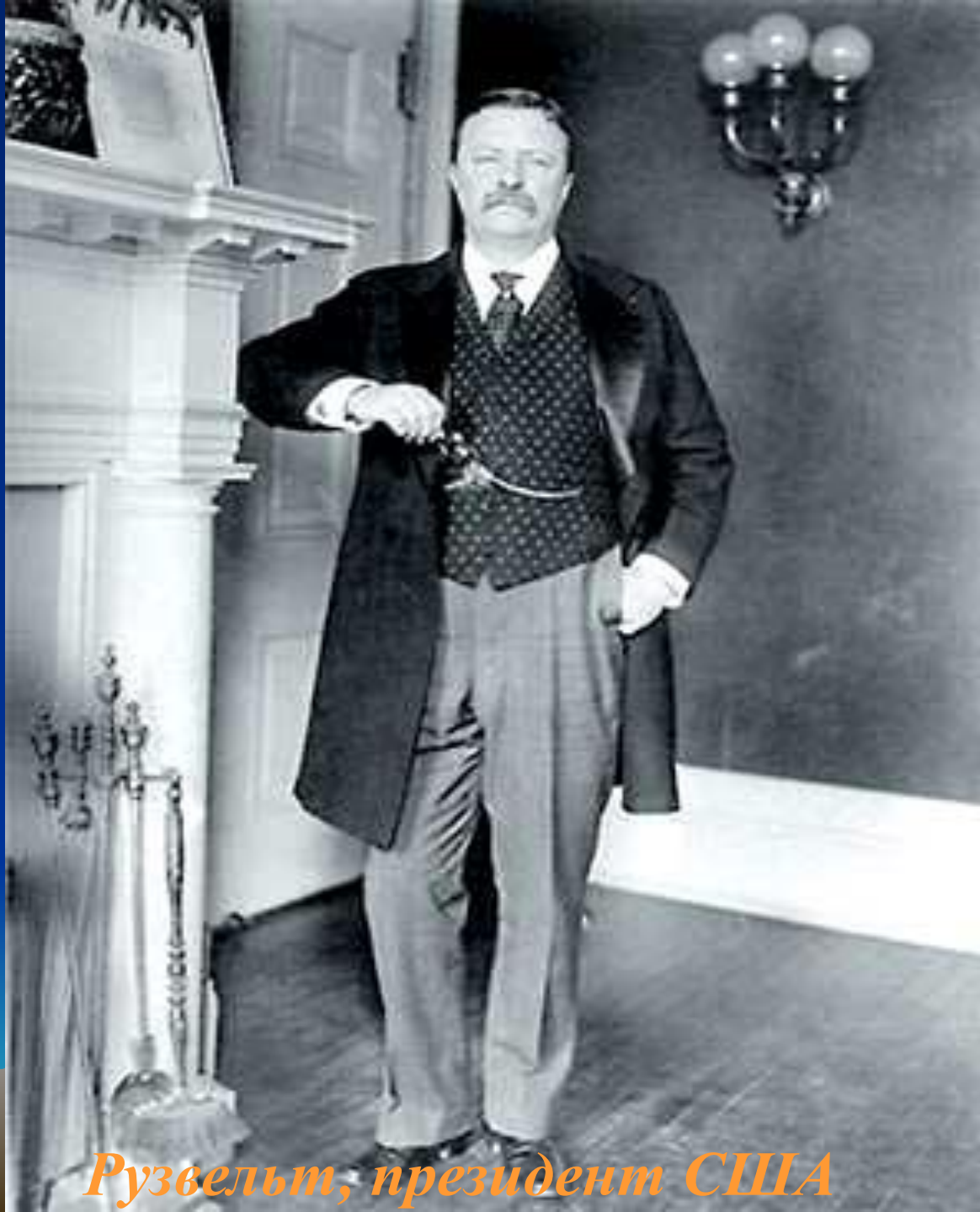
Рузвельт, президент США