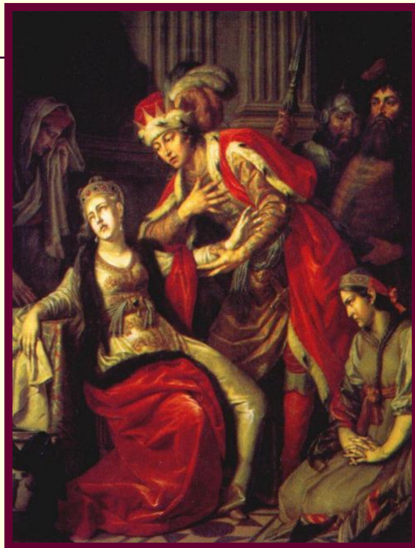
А.Лосенко. Владимир и Рогнеда