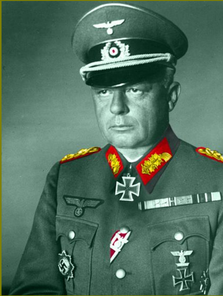
Командующий группой армий « Южная Украина» Генерал – оберст Ганс Фриснер

Перед советскими войсками оборонялась группа армий «Южная Украина» под командованием генерал-полковника Фриснера, включавшая в себя 25 немецких и 22 румынских дивизий. «Яско-Кишиневская операция» привела к полному уничтожению группы армий "Южная Украина", освобождению Молдавии, капитуляции Румынии. Штаб группы армий «Южная Украина» во главе с генерал-полковником Фриснером, потеряв связь с войсками, 23 августа бежал из Галаца в Карпаты.