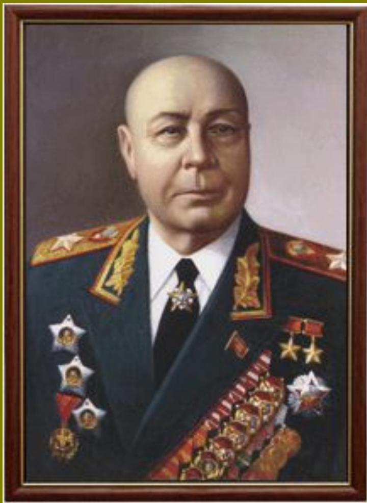
Маршал Советского Союза - Тимошенко Семён Константинович

Маршал, дважды Герой Советского Союза. Советский государственный и военный деятель, полководец. С августа 1944 года и до конца войны командовал 2, 3 и 4 Украинскими фронтами. При его участии был разработан и проведён ряд крупнейших операций Великой Отечественной войны, в том числе «Яско-Кишинёвская». Газета «Правда» 13 сентября 1944 года отмечала, что эта операция явилась одной «из самых крупных и выдающихся по своему стратегическому и военно-политическому значению в нынешней войне».