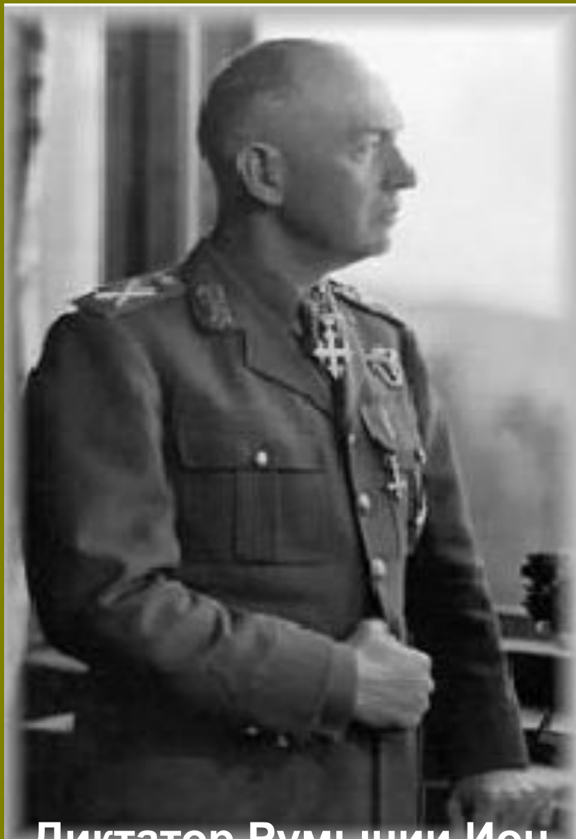
Диктатор Румынии Ион Антонеску

Кароль II в Румынии стал непопулярным королём после значительных территориальных уступок СССР, Венгрии и Болгарии. Этим воспользовалась оппозиция, «Железная гвардия» и Ион Антонеску. В ходе политических споров, 5 сентября 1940 года Кароль вынужден был отречься от престола в пользу своего сына Михая I. При короле Михеае I было сформировано новое правительство, возглавляемое Антонеску.