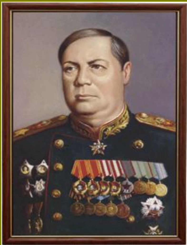
Командующий 3 украинским фронтом Фёдор Иванович Толбухин

В Красной Армии с 1918; сражался на фронтах Гражданской войны. Был награжден орденом Красного Знамени. В годы войны, командовал армией, фронтом. Весной 1943 года Толбухин стал командующим Южным, с мая 1944 и до конца войны — 3-м Украинским фронтом. В августе 1944 совместно с войсками Р. Я. Малиновского разгромили группу армии «Южная Украина» в «Яско-Кишиневской операции». 12 сентября 1944 года – маршал Советского Союза.