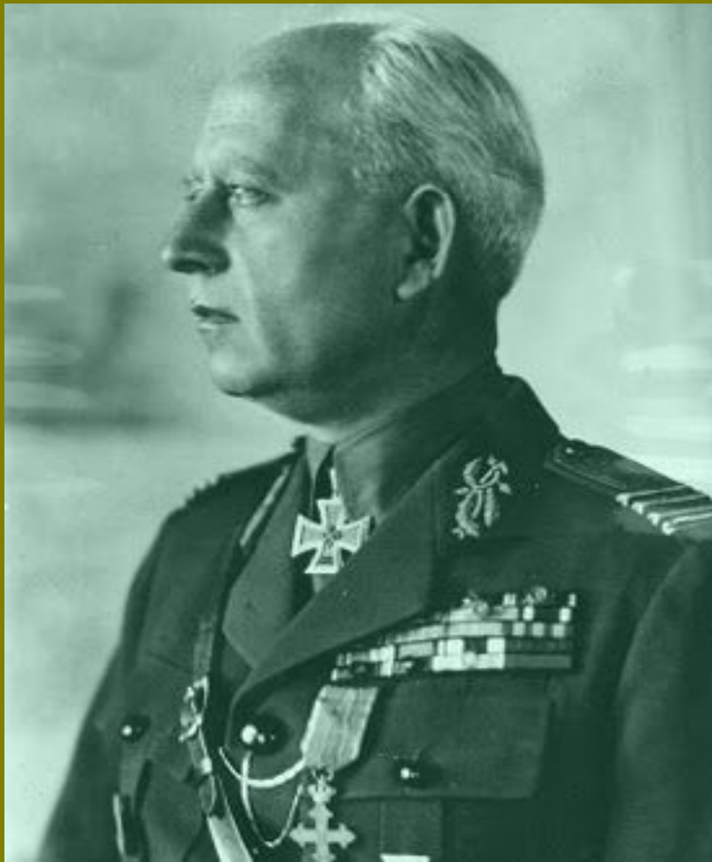
Командующий 3 румынской армией генерал Петру Думетреску

После начала «Яско-Кишинёвской операции» 1944 года армия была сбита с занимаемых рубежей по Днестру. Думитреску отступал к Бухаресту, избегая при этом столкновений с советскими войсками. Но советские войска настигли 3-ю армию, когда остатки 3-й армии подошли к Бухаресту, в плен попало около 130 000 румынских солдат. 23 августа Румыния вышла из войны, и Думитреску повернул оружие против немцев, захватив в плен около 6 000 немецких солдат.