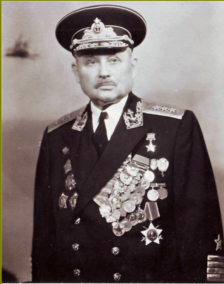
Командующий Черноморским Флотом – адмирал Филипп Сергеевич Октябрьский

Советский военно-морской деятель, адмирал, Герой Советского Союза. В ходе Великой Отечественной войны командующий Черноморским флотом. Черноморский флот под командованием адмирала Филиппа Сергеевича Октябрьского участвовал в «Ясско – Кишинёвской операции». В операции было хорошо организовано и осуществлено взаимодействие двух фронтов и Черноморского военно-морского флота в освобождении Молдавии, а затем на Балканском направлении.