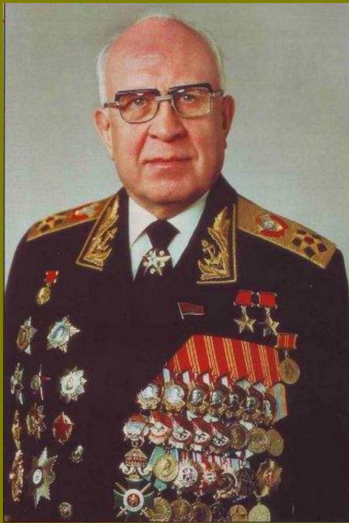
Контр – адмирал Дунайской флотилии Сергей Георгиевич Горшков

Горшков Сергей Георгиевич, советский военный деятель. Адмирал Флота Советского Союза, Герой Советского Союза. С апреля 1944 командовал Дунайской военной флотилией, принимавшей участие в «Ясско- Кишинёвской операции». Корабли её обеспечивали форсирование Днестровского лимана войсками 3-го Украинского фронта, прорвались в дельту реки Дунай и, высадив десанты, захватили ряд портов и баз, что способствовало победе в операции.