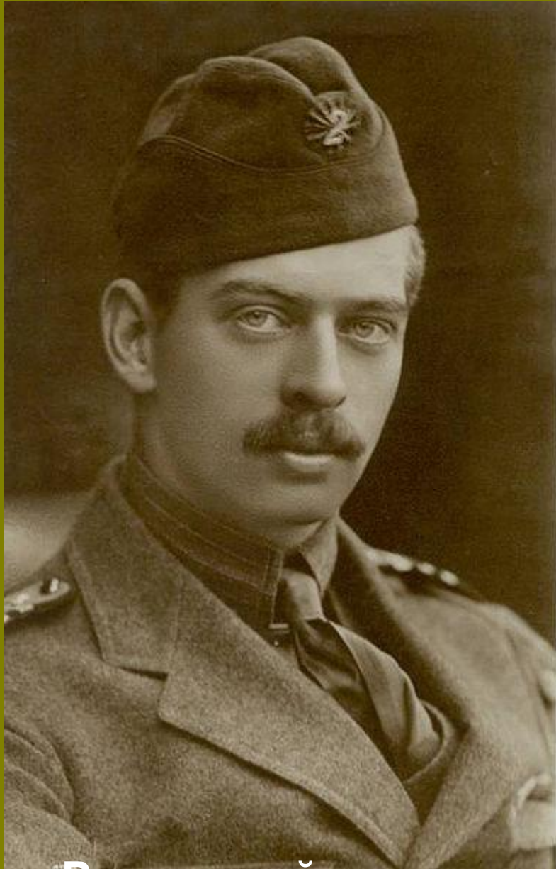
Румынский король Кароль II

После смерти отца Фердинанда в 1927 году Кароль вернулся в Румынию, сместил своего 8-летнего сына Михая I и вступил на престол. В 1938 году установил диктатуру, запретил политические партии и профсоюзы. Лишившись британской поддержки, был вынужден признать Венский арбитраж 1940 года и присоединение Бессарабии к СССР, вскоре после чего был смещён Ионом Антонеску и покинул страну, а королём вновь стал его сын Михай.