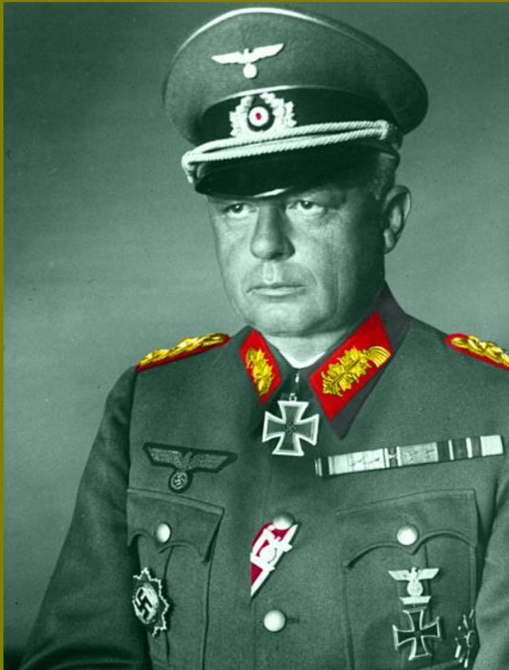
Командующий группой армий « Южная Украина» Генерал – оберст Ганс Фриснер

Перед советскими войсками оборонялась группа армий «Южная Украина» под командованием генерал-полковника Фриснера, включавшая в себя 25 немецких и 22 румынских дивизий. «Яско-Кишиневская операция» привела к полному уничтожению группы армий "Южная Украина", освобождению Молдавии, капитуляции Румынии. Штаб группы армий «Южная Украина» во главе с генерал-полковником Фриснером, потеряв связь с войсками, 23 августа бежал из Галаца в Карпаты.