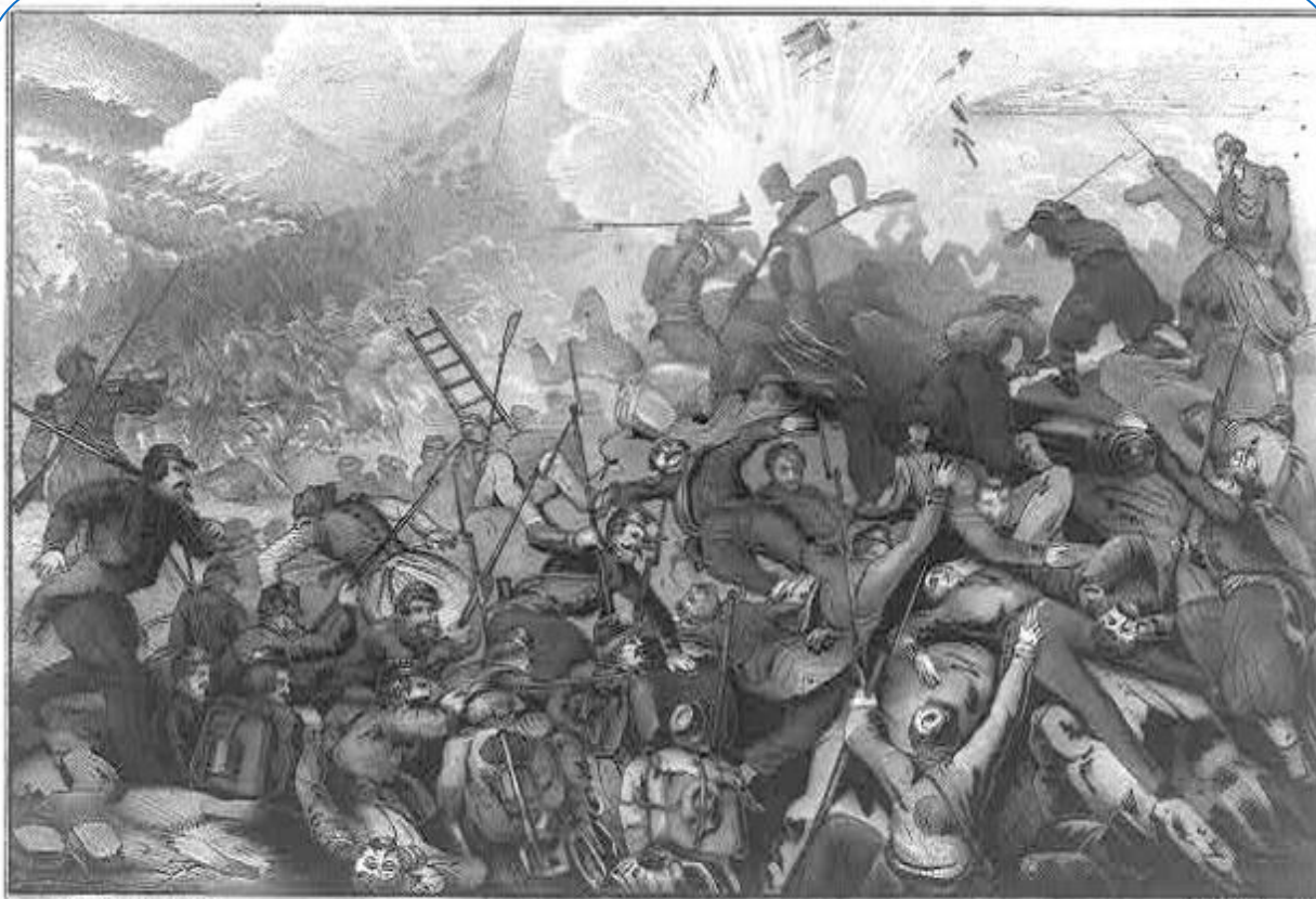
THE FALL OF SEBASTOPOL. CAPTURE OF THE MALAKOFF TOWER