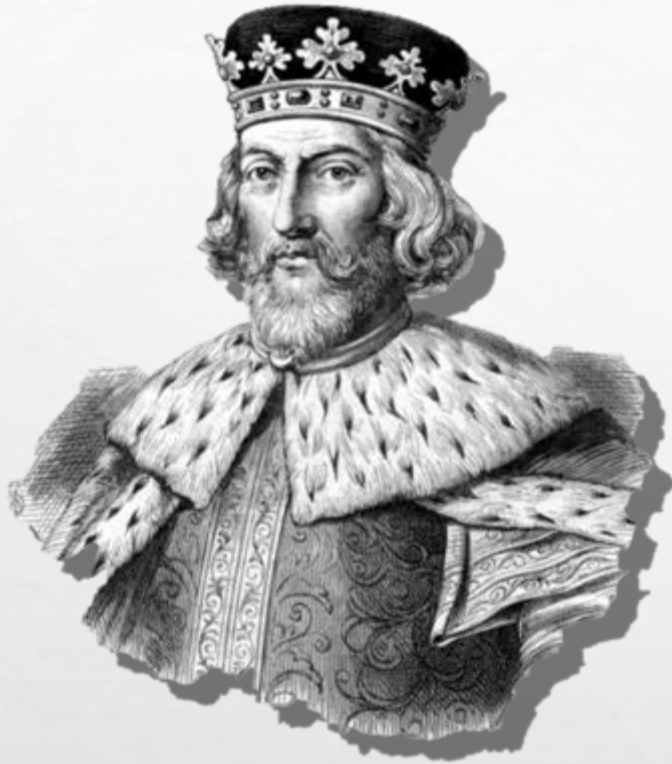
Иоанн Безземельный (1199-1216)