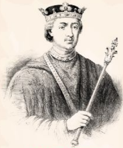
Король Франции. Филипп II Август

Король Франции Филипп II Август (1180–1223 гг.) мечтал вернуть земли Плантагенетов французской короне.