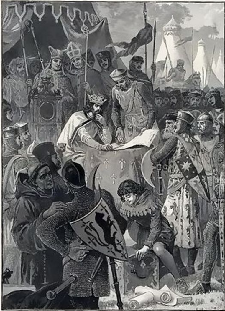
KING JOHN SIGNING THE GREAT CHARTER. (See p. 208.)