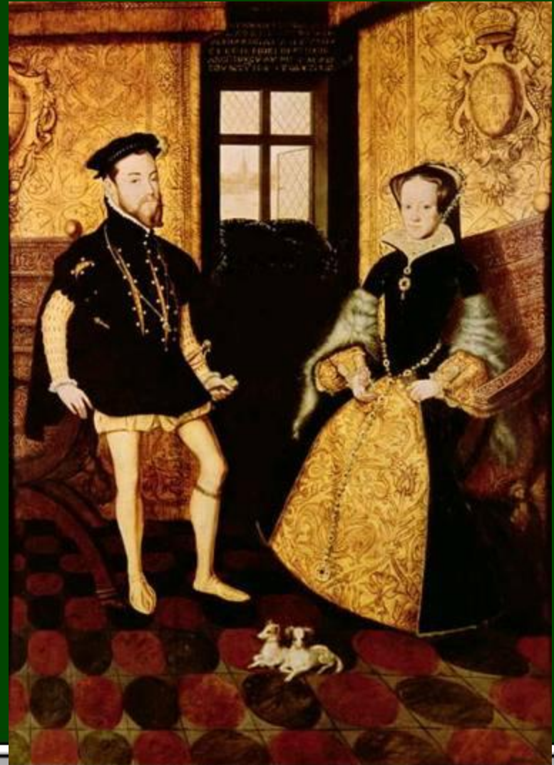
King Philip II and Queen Mary I, 1558 by Hans Eworth, Woburn Abbey, UK.