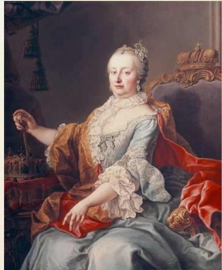
Мария Терезия Австрийская

Победила сторона Марии Терезии. Но Пруссия , захватив Силезию, стала угрожать дальнейшей стабильности.