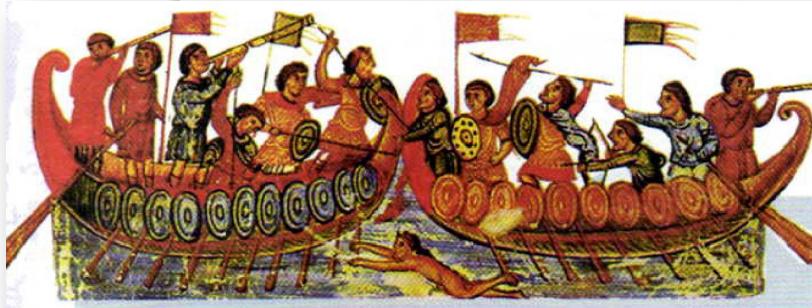
Морское сражение. Византийская миниатюра. VI—VII вв.