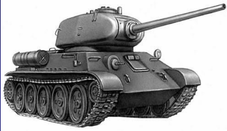
Средний танк Т-34