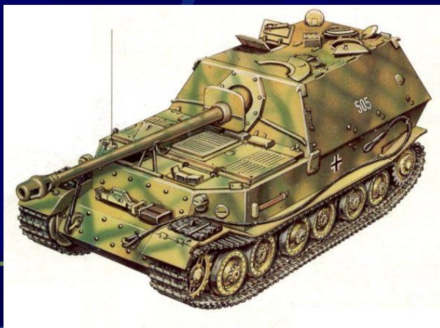
Самоходное орудие Фердинанд