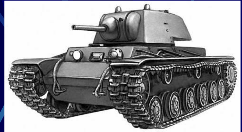
Тяжелый танк КВ-1