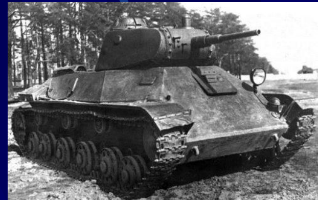
Легкий танк Т-50