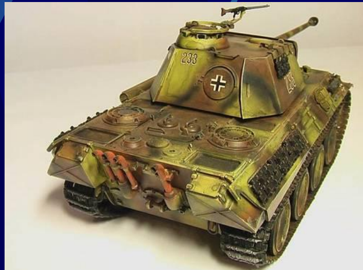
Средний танк - Пантера