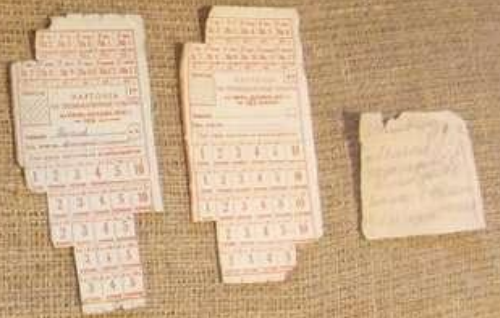
Хлеб, выпечившийся на Ленинградских заводах Bread baked according to the recipe of the time of the blockade