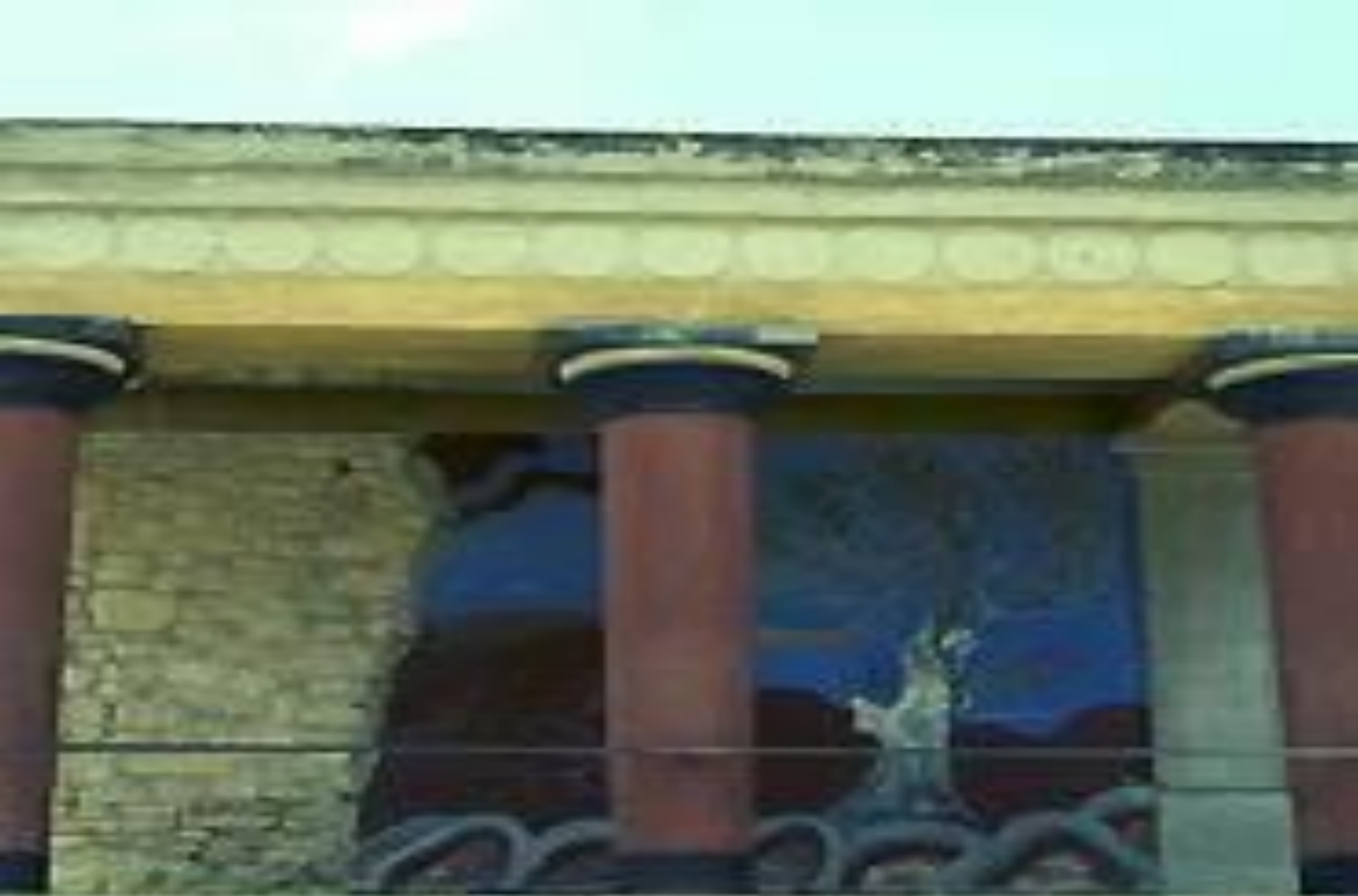
Дворец на о.КРИТ