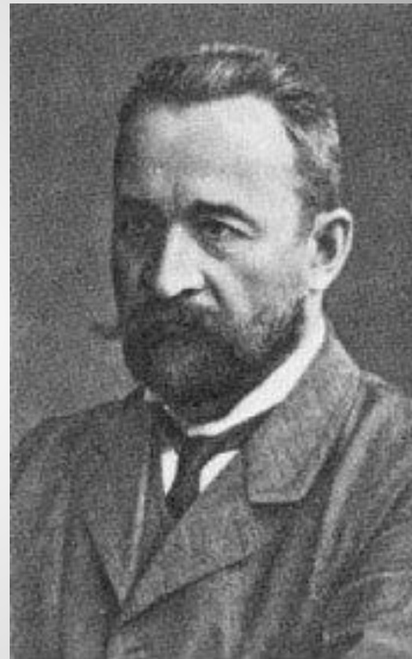
Львов Георгий Евгеньевич - князь, русский политик