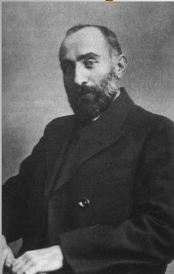
Чхеидзе Николай Семенович