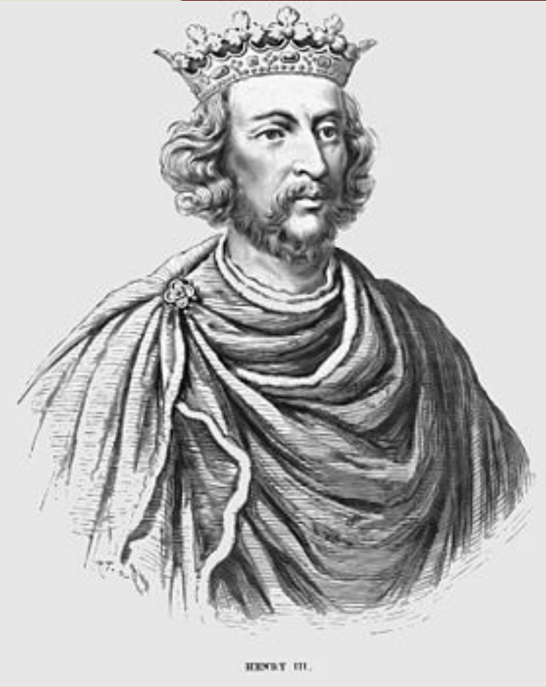
Генрих III Плантагенет. (1216 – 1272г.)

Сын Иоанна Генрих III вызвал недовольство всего населения когда стал раздавать земли родственникам своей жены (французам).