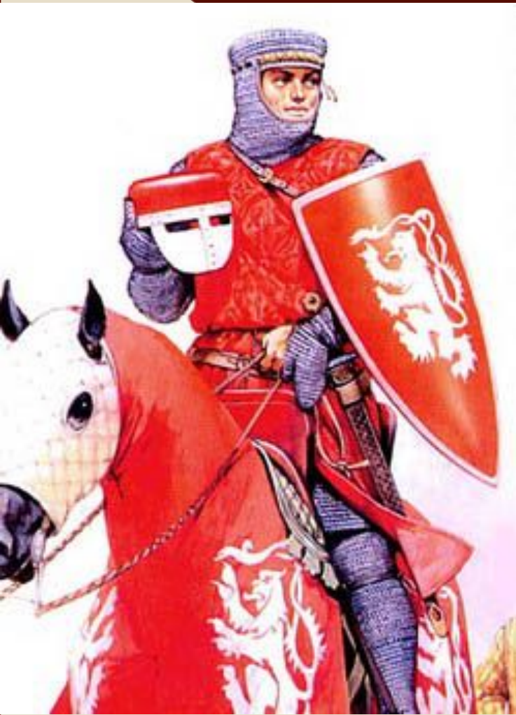
Симон де Монфор.