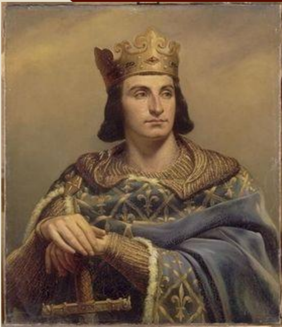
Филипп II Август 1180 – 1223г.

Отвоевал Нормандию; Объединился против Англии с германским императором; Заручился поддержкой крупных феодалов во Франции;