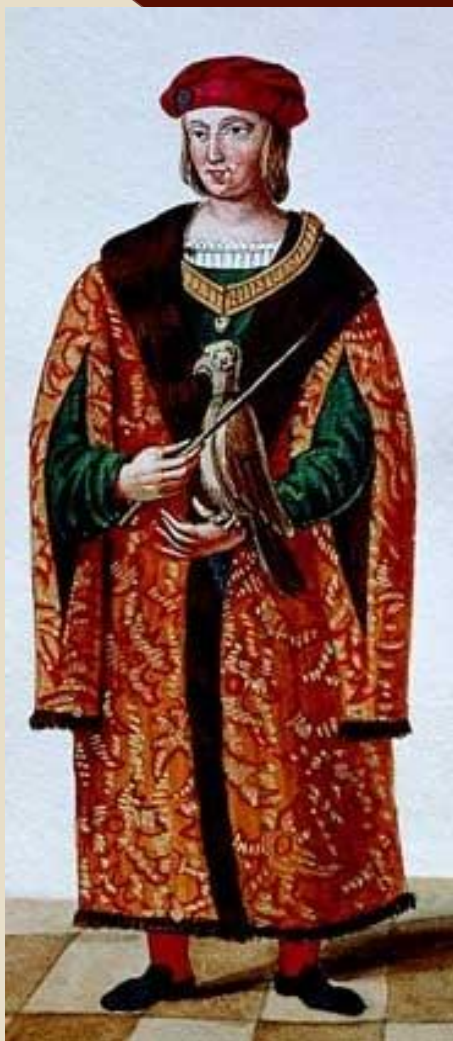
Людовик IX Святой 1226 -1270г.

При Людовике IX король во Франции стал сильнее любого феодала: