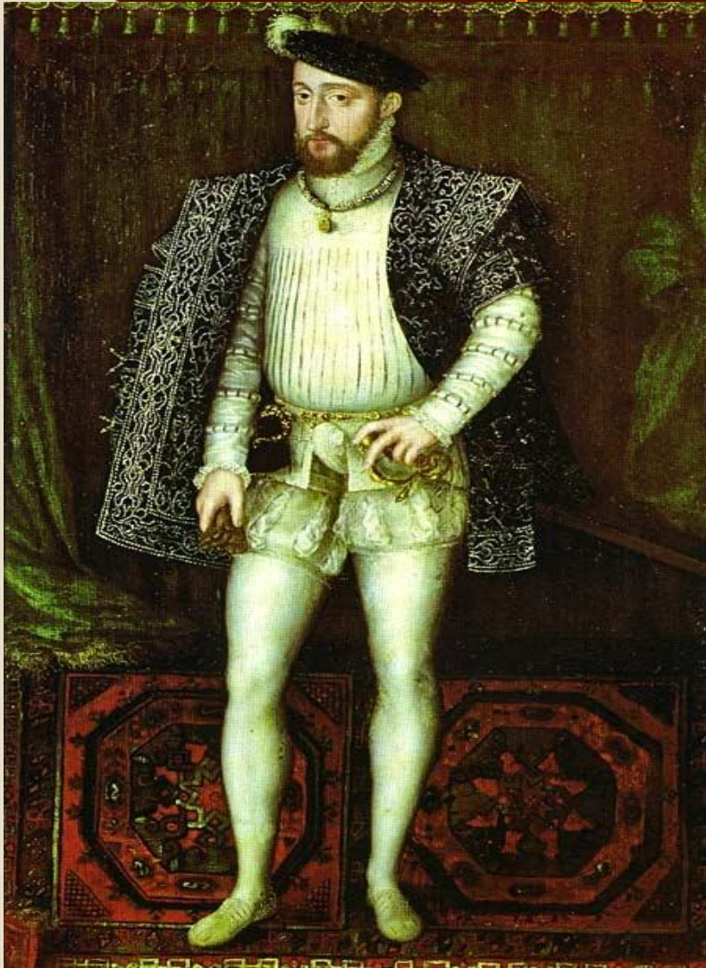
Генрих II Плантагенет. (1133 - 1189г)

Судебная реформа – право англичан минуя суд феодала обратиться к королю