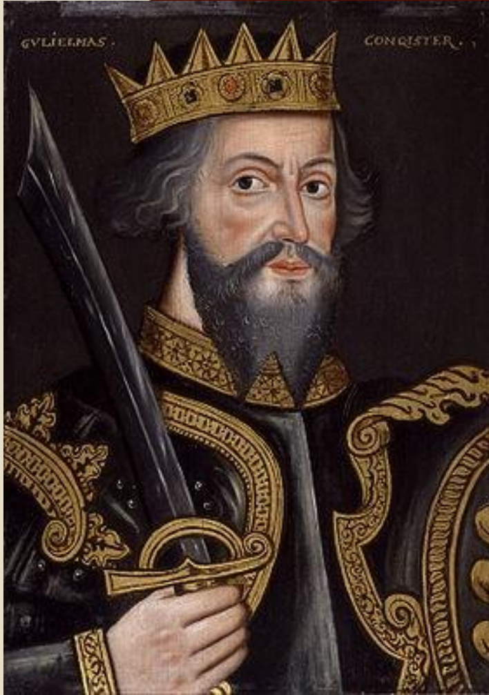
Вильгельм Завоеватель. (1066-1087г.)

В 1066г. Англия была завоевана герцогом Нормандии Вильгельмом.