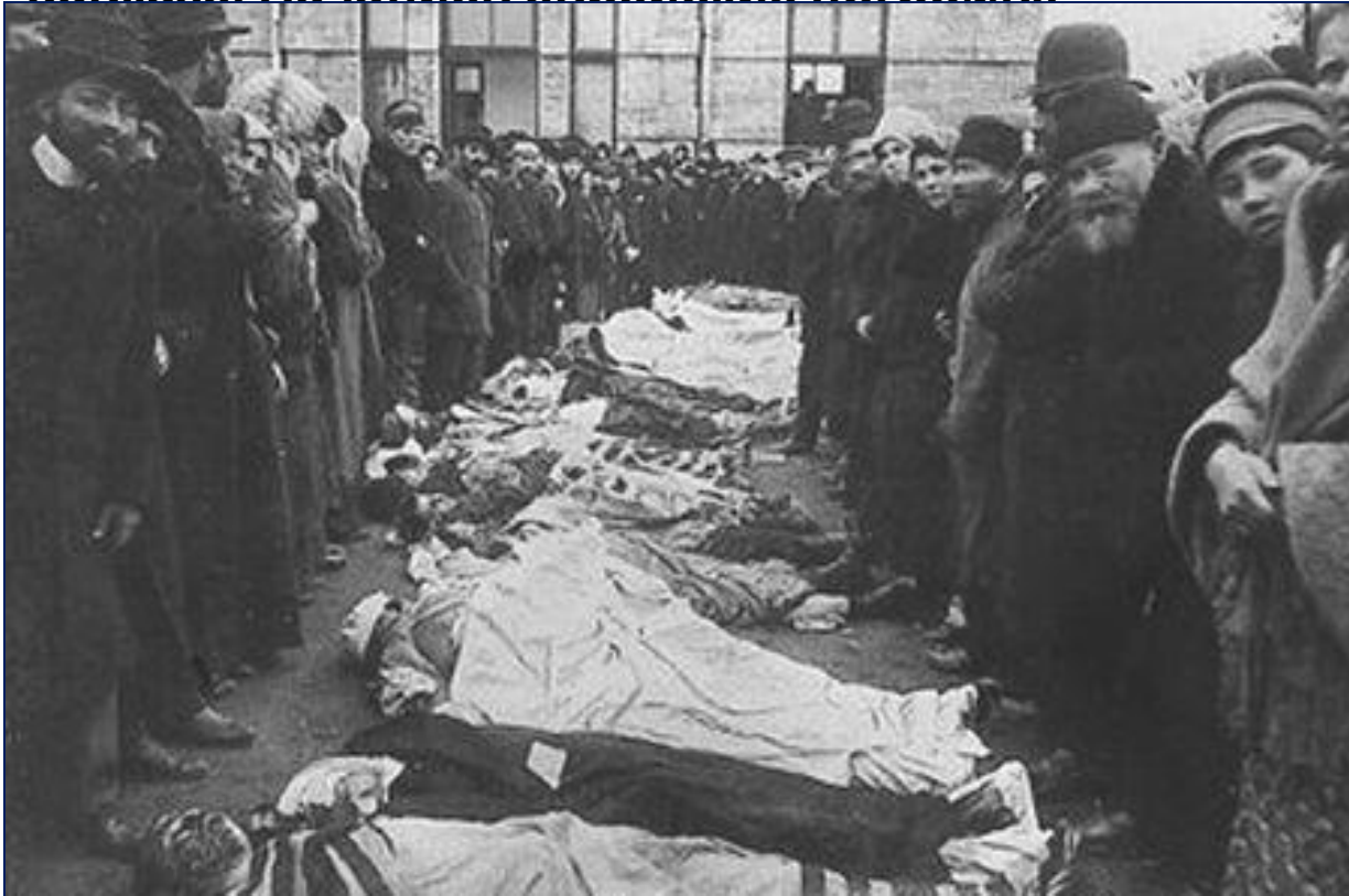
Жертвы еврейских погромов в Кишиневе в 1903 г.

3. Политика царя вызвала разочарование в обществе . Начались студенческие волнения. В феврале 1901 г. Террористом был убит министр просвещения Н.Боголепов. Вспыхнули крестьянские волнения. В 1899 г. Были ограничены права финского сейма, волнения прокатились на Кавказе. Начались еврейские погромы.