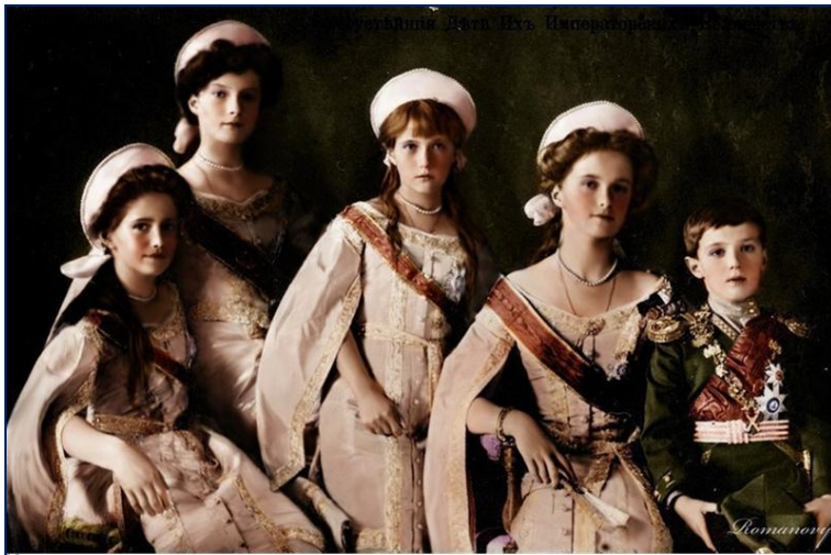
Дети Николая II