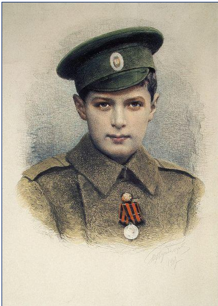
Сын Николая II- Цесаревич и Великий князь Алексей Николаевич. (1904-1918 гг.)

Общество ожидало от нового царя реформ, однако в своей первой публичной речи император заявил, что будет охранять основы самодержавия твердо и неуклонно, как его «незабвенный покойный родитель».