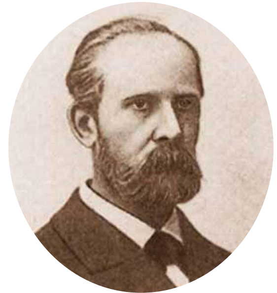
Министр просвещения Н. Боголепов.