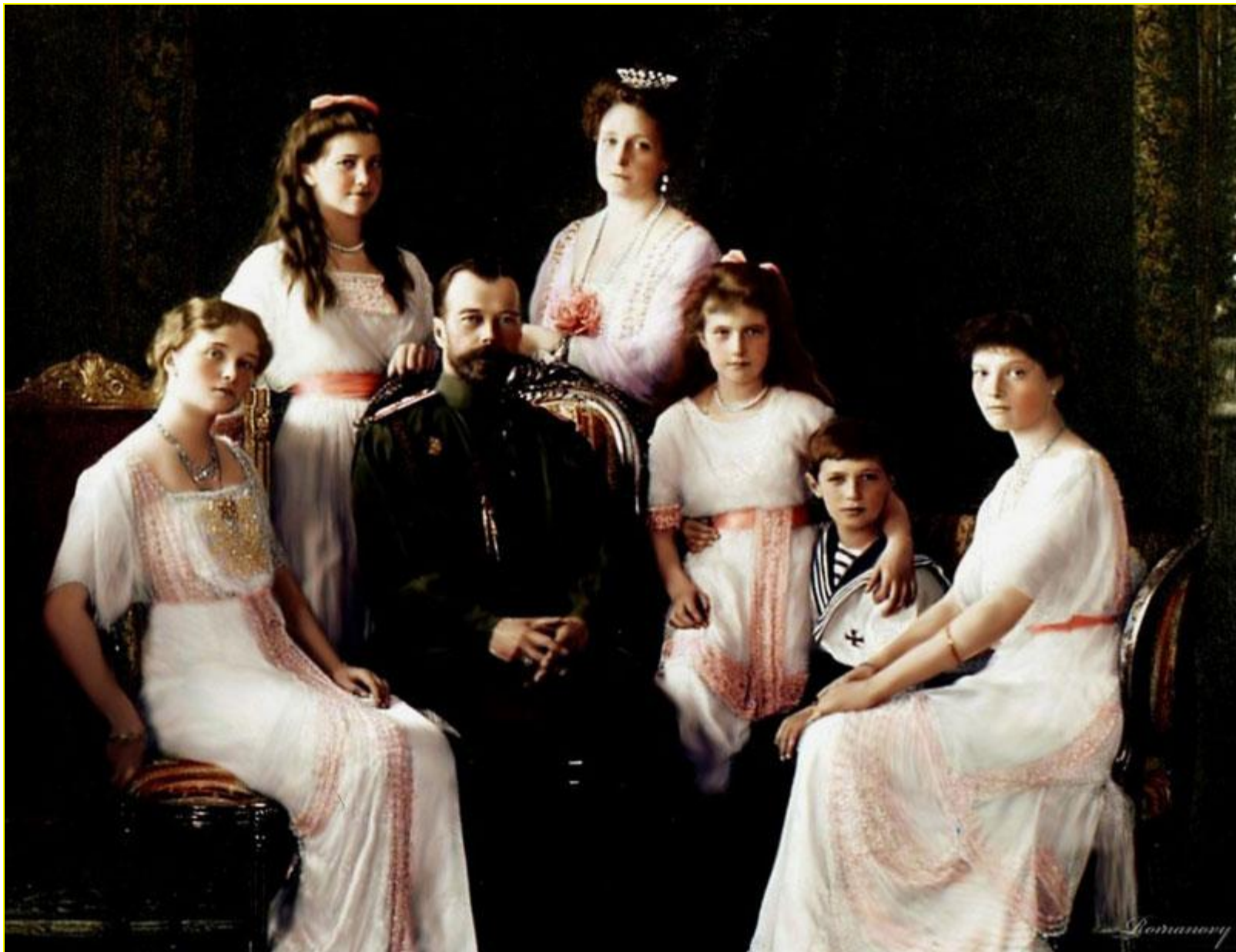
Николай II с семьёй.