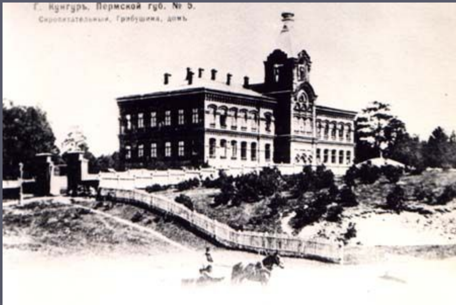
г. Кунгурь, Пермской губ. № 5. Сиропитательный, Грибушина, домъ