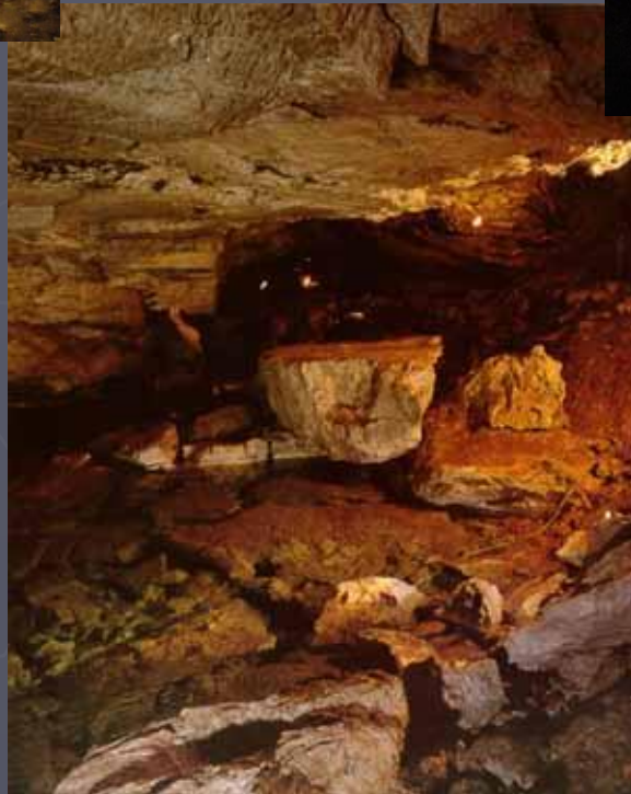
Большое подземное озеро