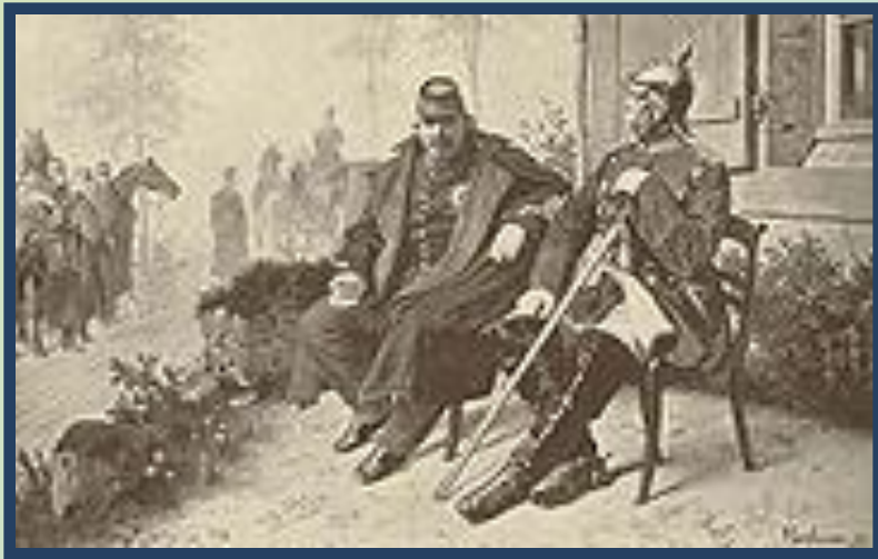
Наполеон III в плену у Бисмарка.