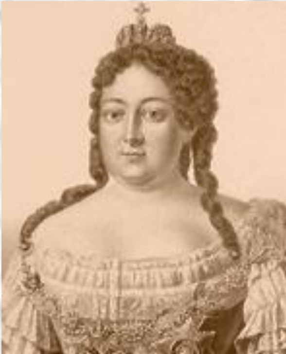
Анна Иоановна (1730 -1740гг.)