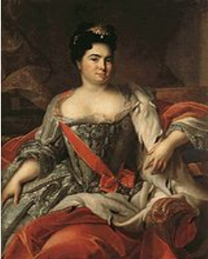
Екатерина I (1725 -1727гг.)