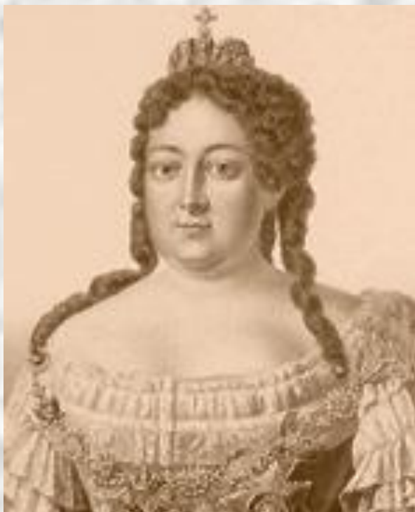
Анна Иоановна (1730 -1740гг.)