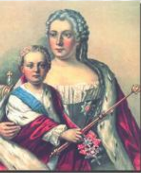
Иоанн VI Антонович с матерью Анной Леопольдовной (1740-1741гг.)