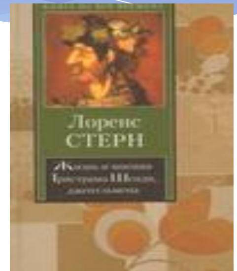
«Жизнь и убеждения Тристрама Шенди»