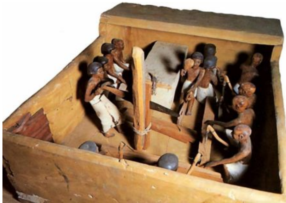
Модель древнеегипетской мастерской