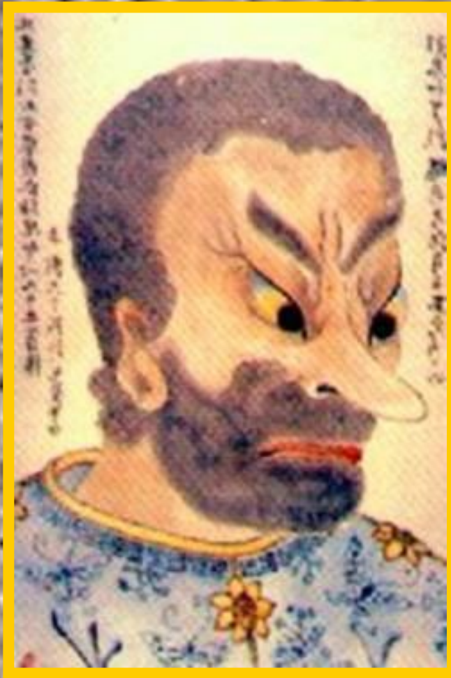
Перри .Глава американской эскадры.

Между 2 странами был подписан торговый договор.Вскоре договоры были заключены с Англией,Россией, Голландией, Францией и Прус-сией.Для торговли бы-ли открыты 2 порта.