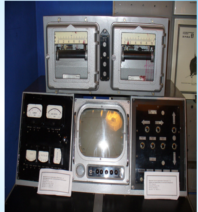
Пульт дистанционного управления Луноходом