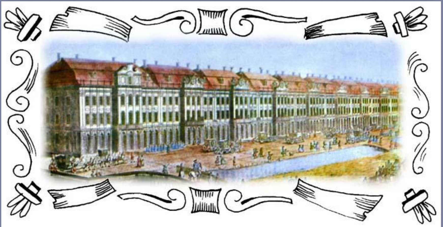
Здание 12 коллегий, архитекторы Земцов и Трезини