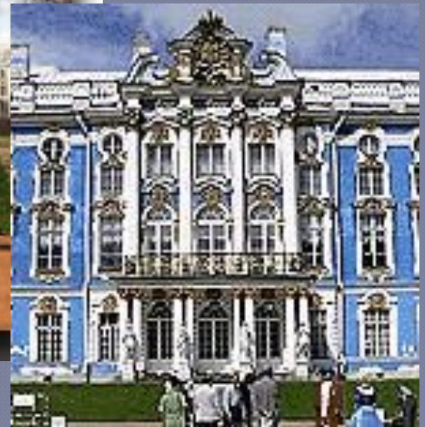
Екатерининский дворец в Царском селе, Архитектор Ф. Б. Растрелли. 1752-1757 гг