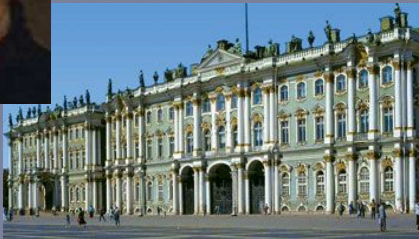
Зимний дворец, архитектор Ф.Б. Растрелли.