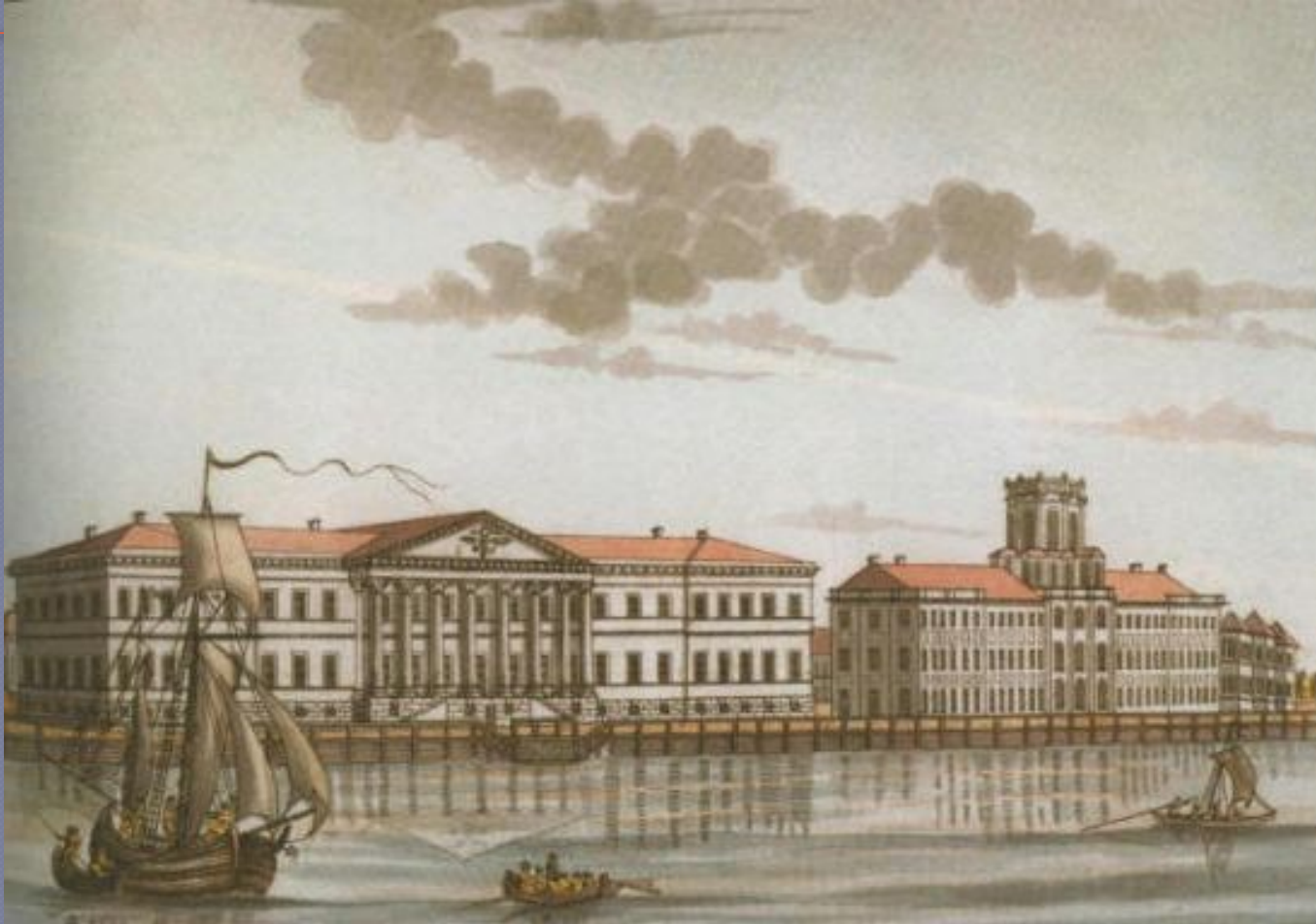
Здание Академии Наук, архитектор Дж. Кваренги, Санкт-Петербург, 1783-1789 гг