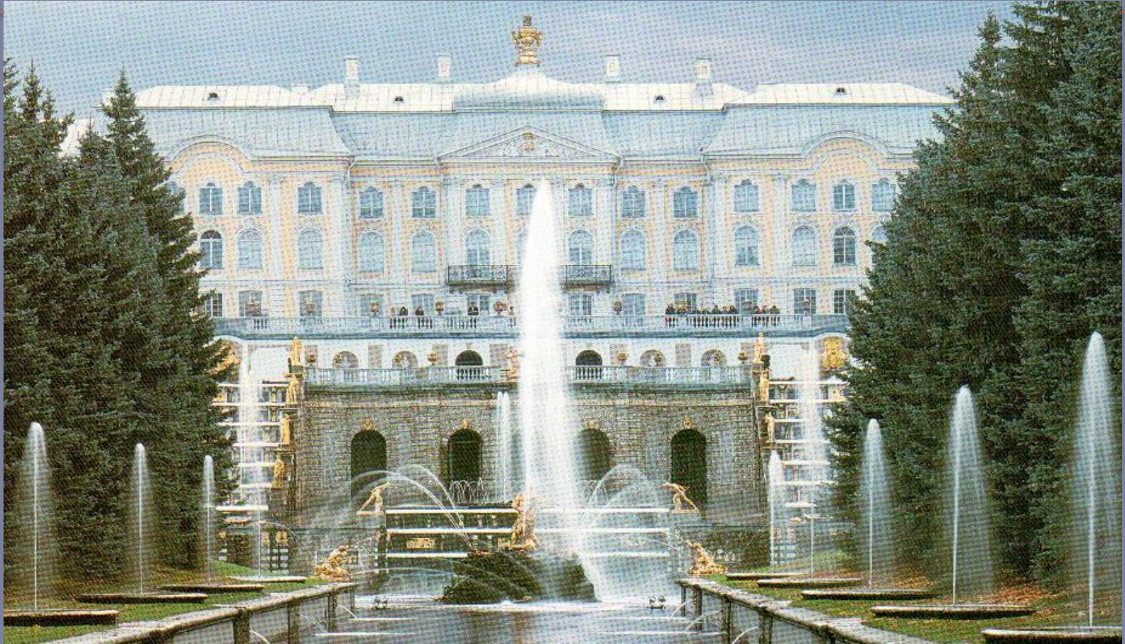
Большой дворец в Петергофе, архитектор Ф. Б. Растрелли