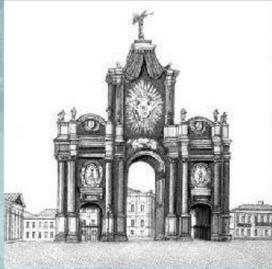
Красные ворота в Москве. Архитектор Д.В. Ухтомский.