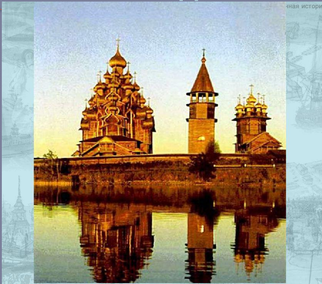
Кижский погост - старинное русское поселение на одном из островов Онежского озера.