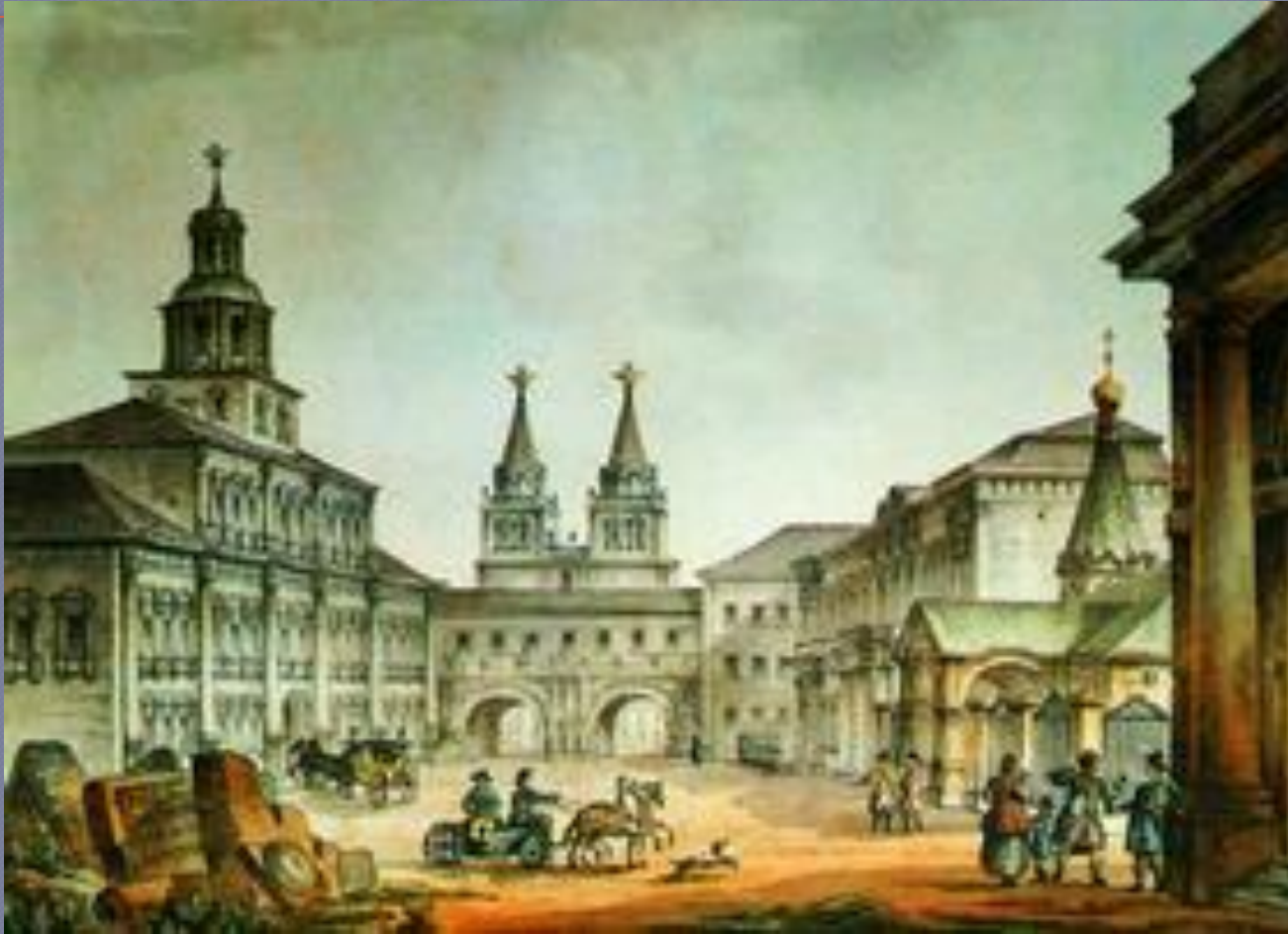
Вид на Воскресенские ворота со стороны Красной площади, архитектор Дж. Кваренги,