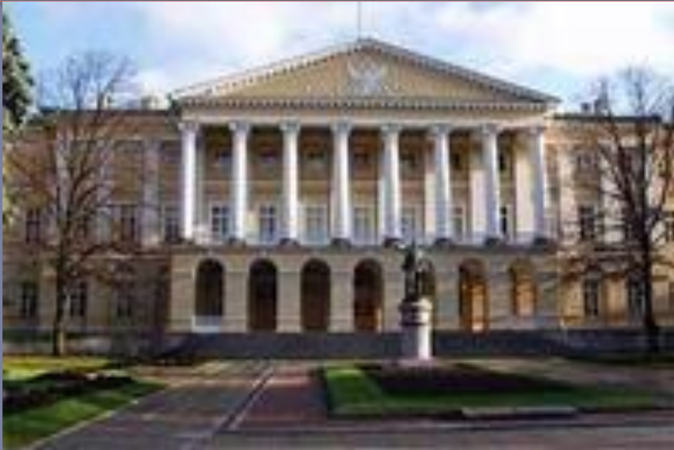
Смольный, архитектор Дж. Кваренги,