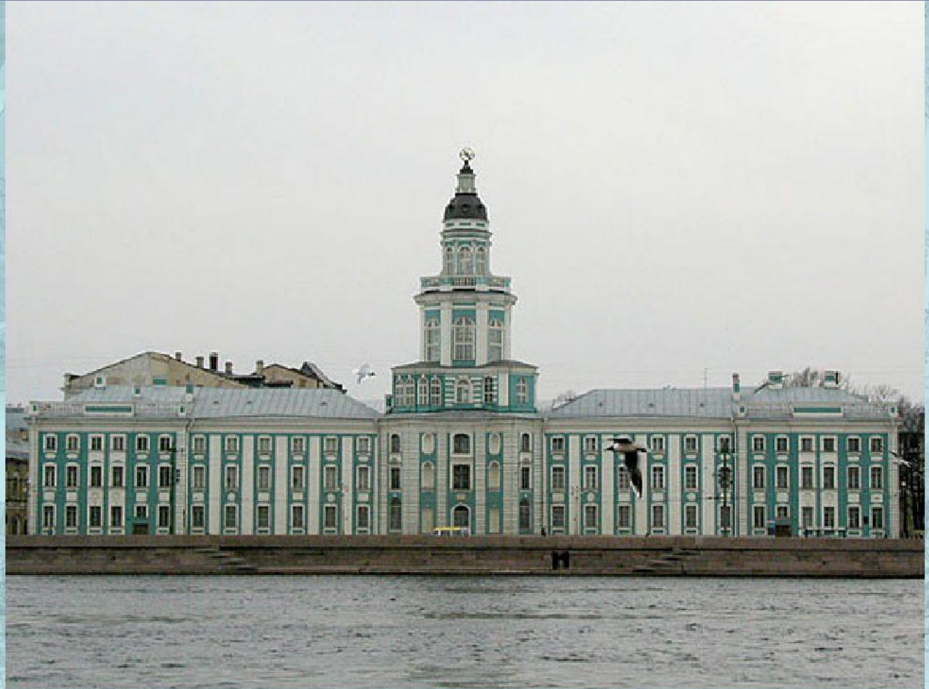
Здание Кунсткамеры, основанной Петром I в 1714 году.

архитекторы М. Земцов, Г. Маттарнови, Н. Гербель, Г. Кьявери. Санкт- Петербург, 1718-1734 гг