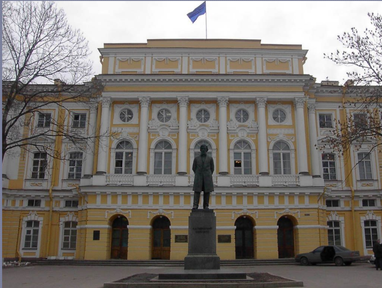
Главный корпус Педуниверситета , архитектор Кокоринов