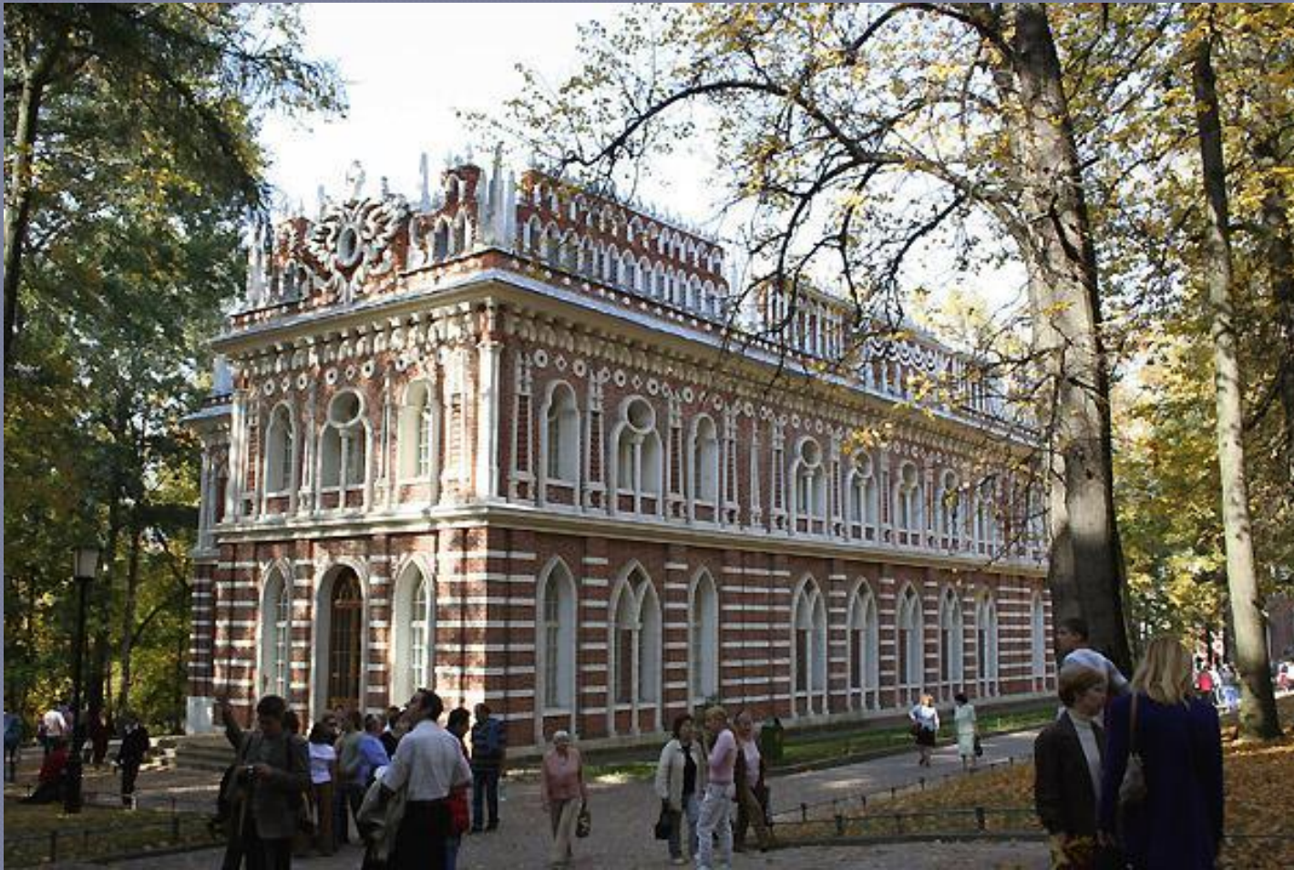
Дворец в Царицыно, Архитектор В.И. Баженов, 1775-1785 гг