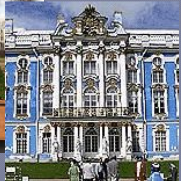
Екатерининский дворец в Царском селе, Архитектор Ф. Б. Растрелли. 1752-1757 гг