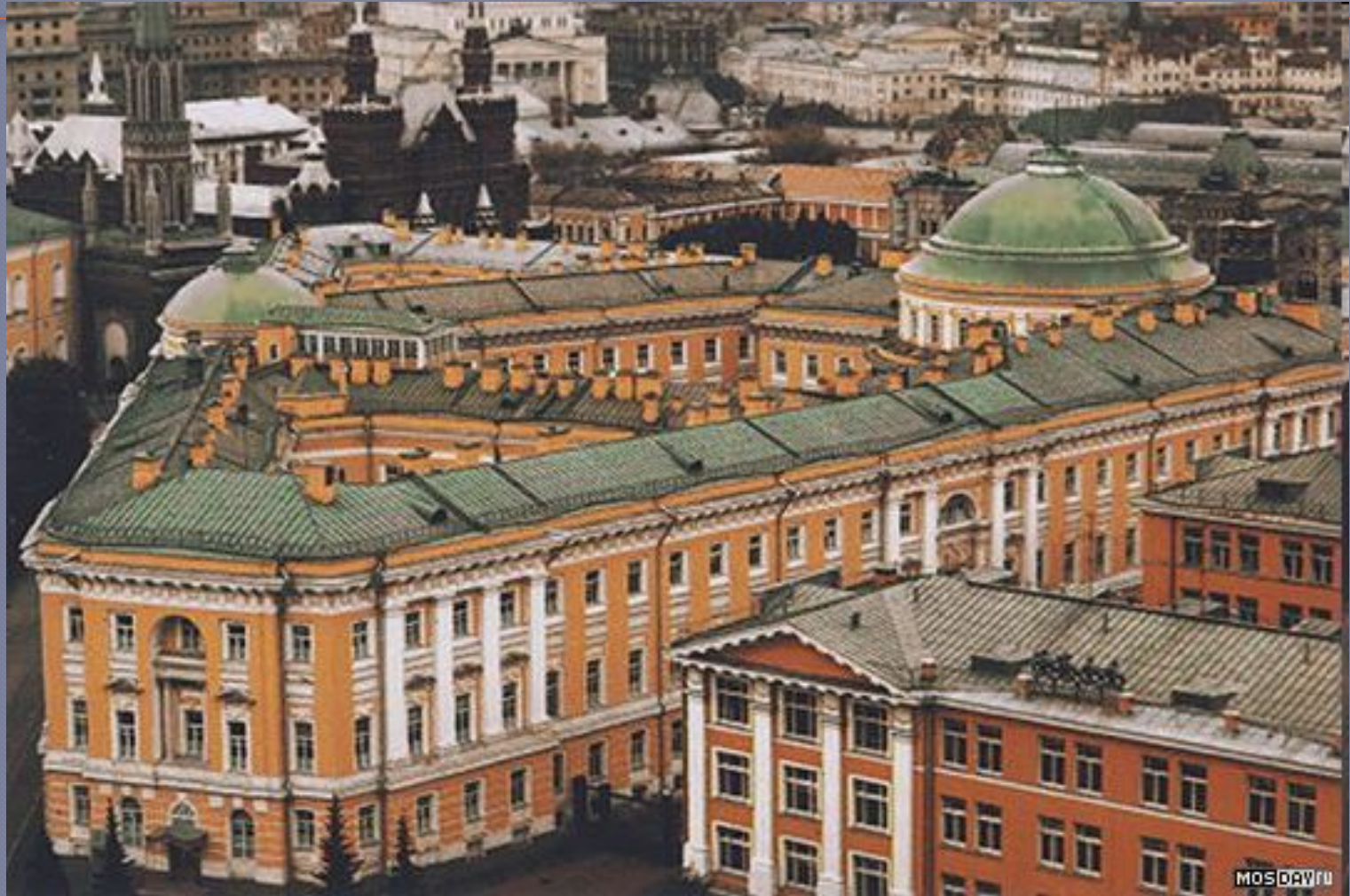
Здание Сената в Кремле. Архитектор Казаков