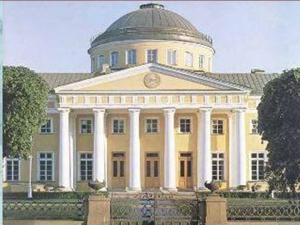
Таврический дворец в Санкт-Петербурге. Архитектор И.Е. Старов.