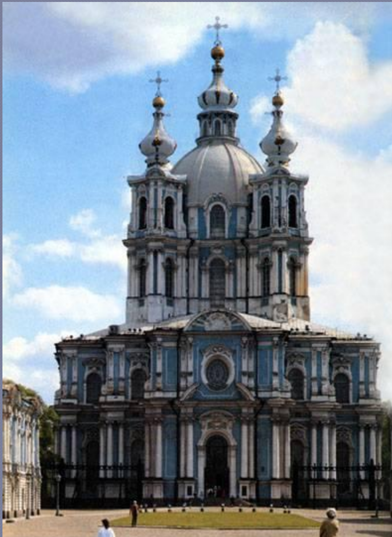
Смольный монастырь, Санкт-Петербург, архитектор Ф. Б. Растрелли