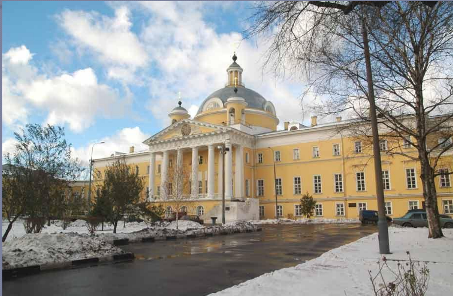
Голицинская больница , архитектор М.Ф. Казаков