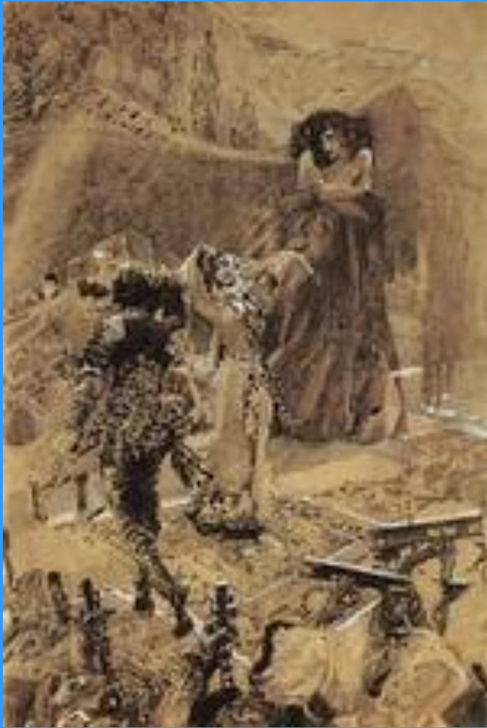
Демон, смотрящий на танец Тамары