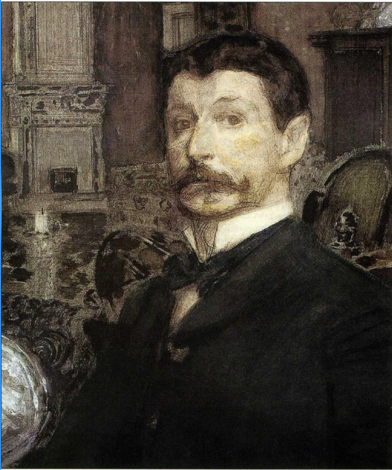
М.А.Врубель. Автопортрет с раковой

Никто из иллюстраторов Лермонтова ни до, ни после Врубеля не подошел к его творческому и философскому мирозерцанию так близко, как это удалось художнику, заколдованному «Демоном» Лермонтова и своим собственным.