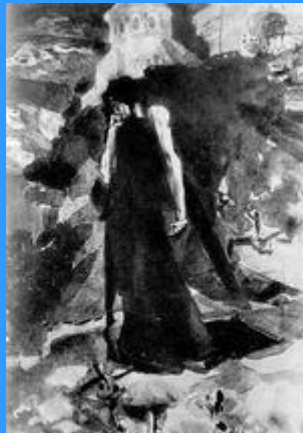
Демон у стен монастыря