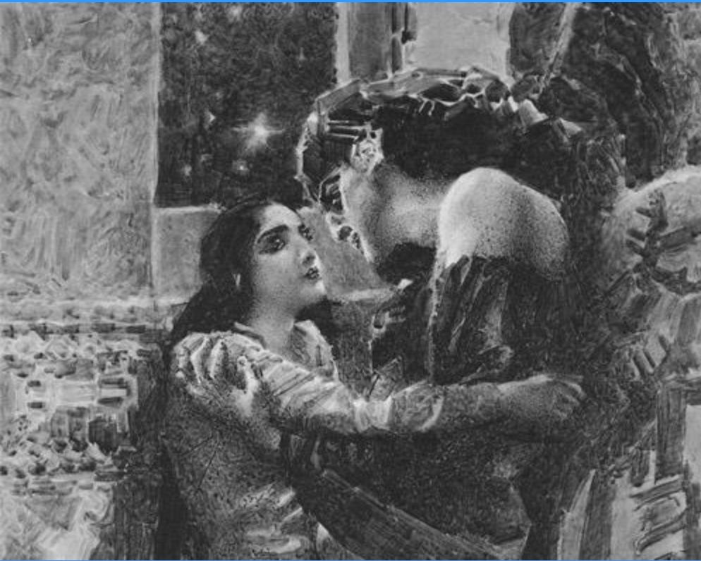
Свидание Тамары и Демона