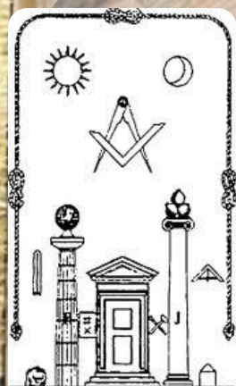
Символы масонского храма