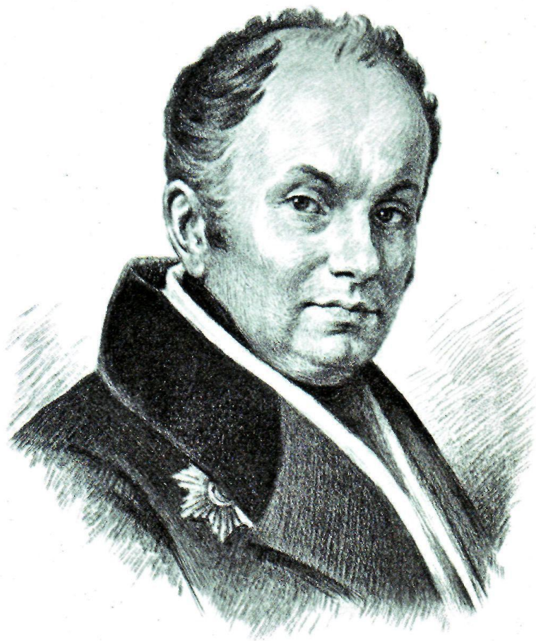
Василий Андреевич ЖУКОВСКИЙ (1783—1852)

После «Руслана и Людмилы» Жуковский надписал Пушкину свою фотографию: «Победителю-ученику от побежденного учителя». Жуковский был рядом с Пушкиным на протяжении почти всей его жизни. Он неоднократно заступался за Пушкина перед царем и находился у постели смертельно раненного поэта в его последней квартире на набережной реки Мойки, в доме 12. Он вывешивал сообщения о состоянии великого поэта.