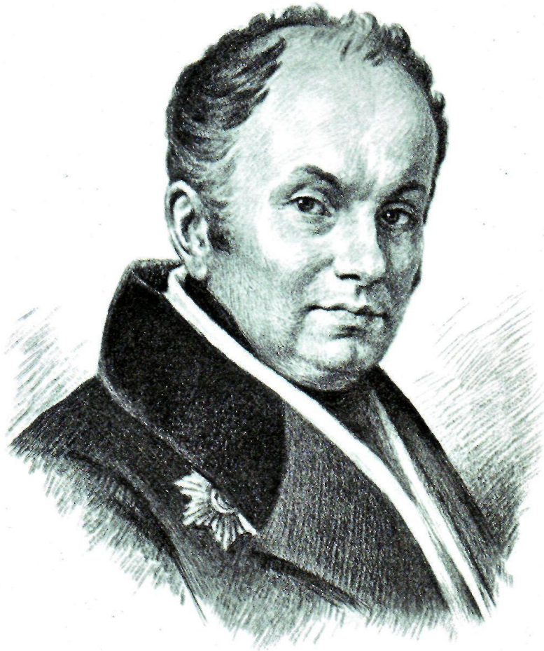
Василий Андреевич ЖУКОВСКИЙ (1783—1852)

После «Руслана и Людмилы» Жуковский надписал Пушкину свою фотографию: «Победителю-ученику от побежденного учителя». Жуковский был рядом с Пушкиным на протяжении почти всей его жизни. Он неоднократно заступался за Пушкина перед царем и находился у постели смертельно раненного поэта в его последней квартире на набережной реки Мойки, в доме 12. Он вывешивал сообщения о состоянии великого поэта.