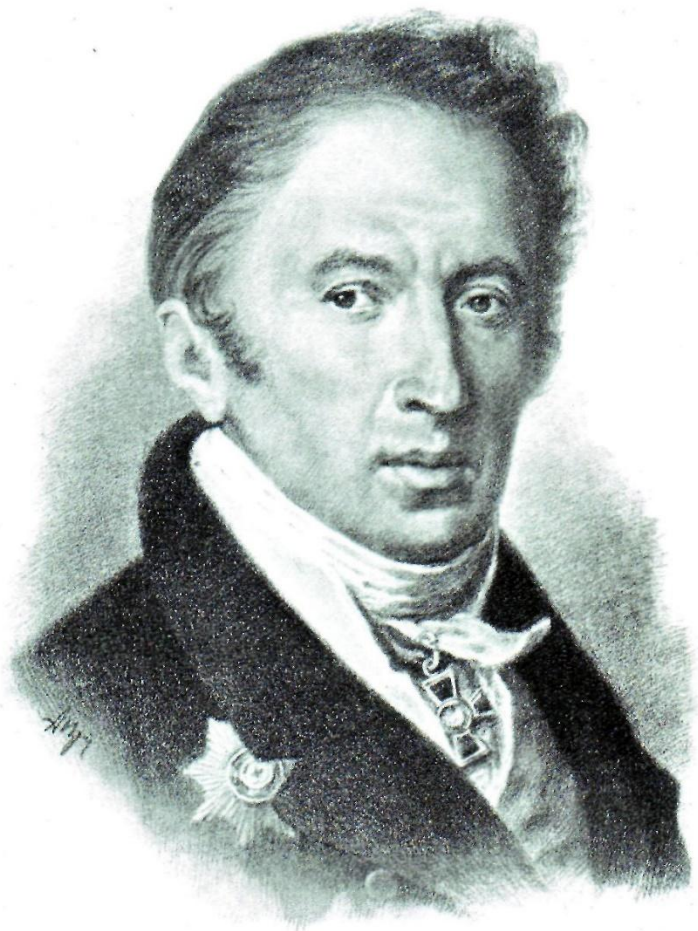
Николай Михайлович КАРАМЗИН (1766—1826)

Интерес к истории был небывалый: читающая Россия ждала завершения огромного труда Н.М. Карамзина об Отечестве. «История государства Российского» — так называлось его многотомное издание, которое не потеряло своего значения и для современности. Власть озаботилась необходимостью воспитания чиновников высшего уровня — в Царском Селе под Петербургом открылся Лицей. Его будут называть пушкинским: Пушкин был лицеистом первого набора.