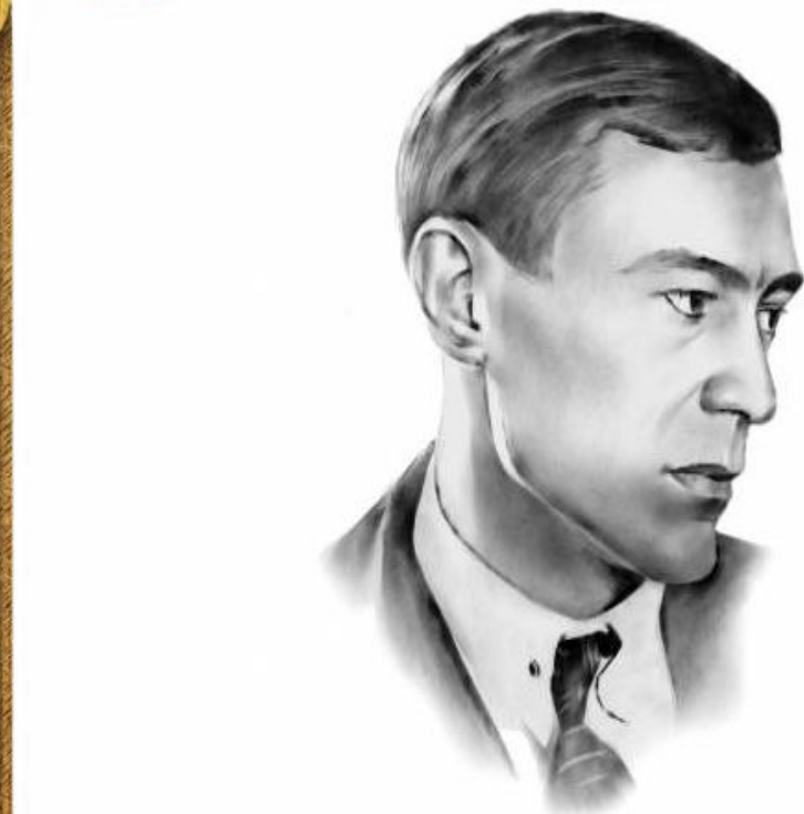
Портрет В. Підмогильного