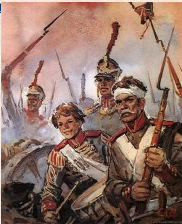
Герои Бородинской битвы

Афанасий Столыпин – брат бабушки поэта, участник войны 1812 года, артиллерист- «бородинец». Он когда-то живо и образно поведал М.Ю.Лермонтову о ходе великой битвы. Еще в юношеском стихотворении «Поле Бородина» Лермонтов выразил восхищение подвигом русских воинов. Многие мотивы этого произведения были позднее переосмыслены и вошли в окончательный вариант «Бород