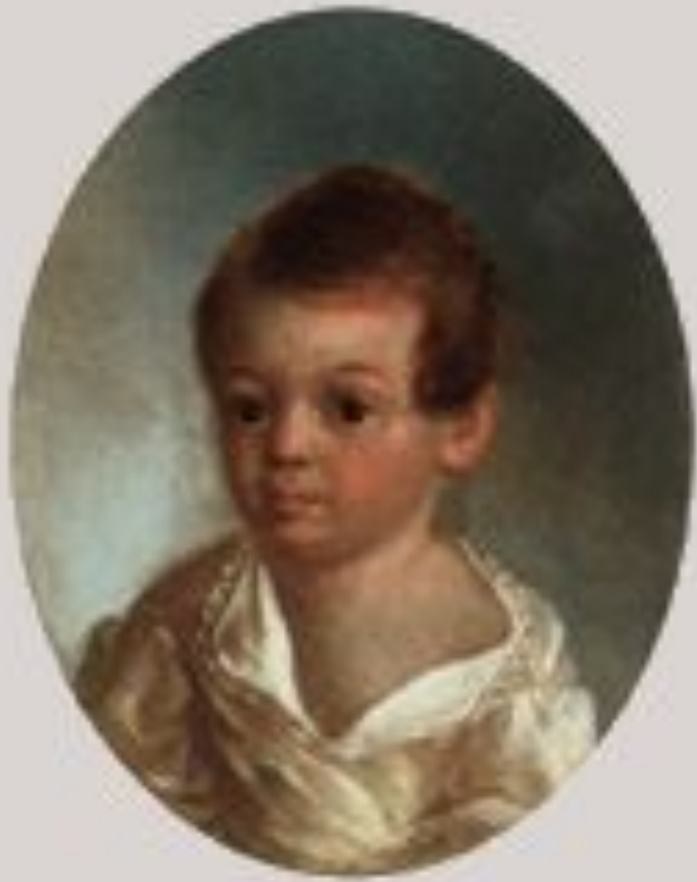
К. Де-Местр. Пушкин-ребенок (1801-1802)