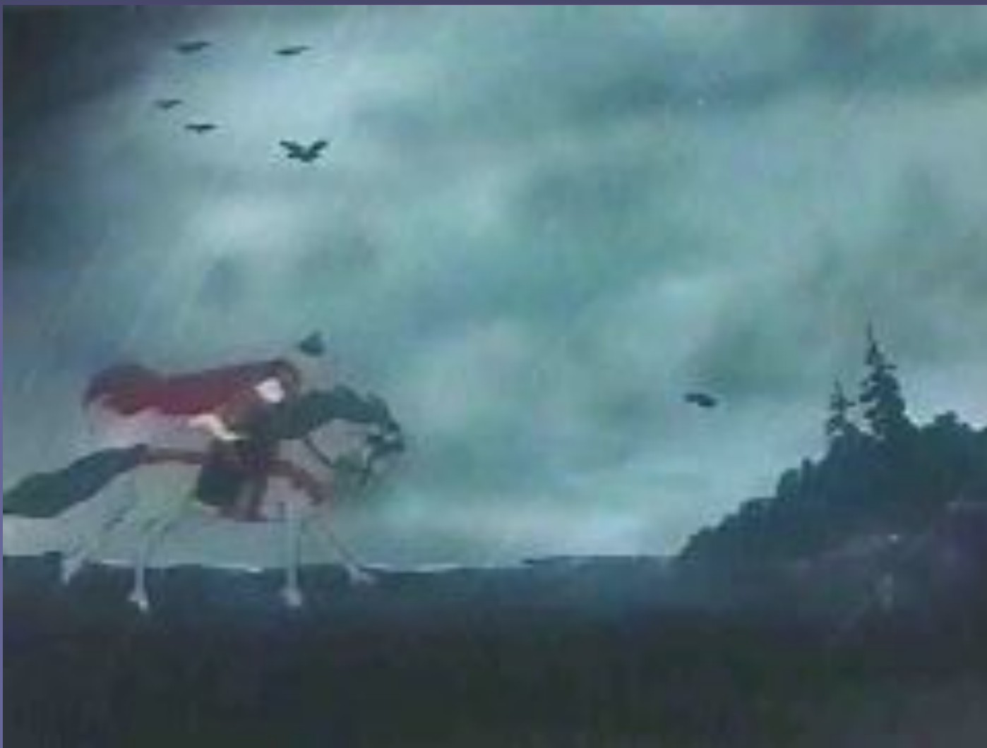
Фрагмент из мультфильма «Сказка о мертвой царевне и семи богатырях».