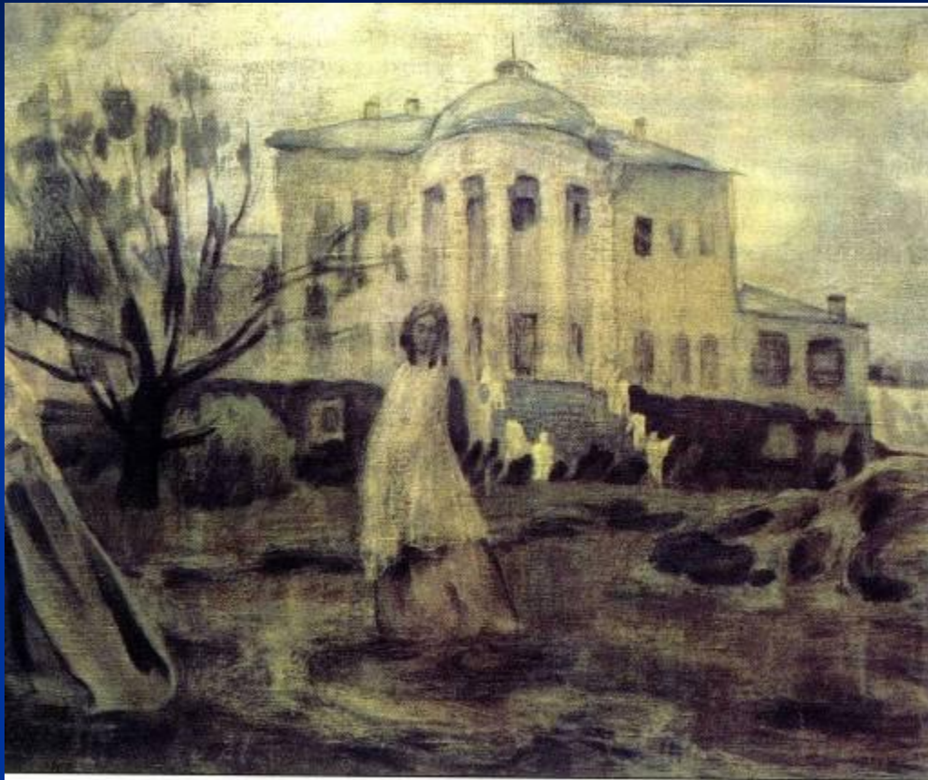
В.Э.Борисов-Мусатов. «Призраки». 1903