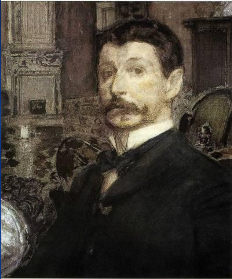
М.А.Врубель. Автопортрет с раковинной

В искусстве серебряного века Врубель представляет собой фигуру ключевого значения: в его творчестве нашли свое отражение как идеи модерна и символизма, так и зачатки новых художественных направлений.