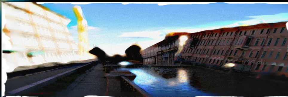
Последний сон Раскольникова

Первый сон - предупреждение человека, последний сон - предупреждение человечества о расплате за преступление через страдание. Люди, заражённые трихинами, одержимы безоглядной верой в себя, свои идеи, они страшны, ибо не способны слышать и понимать друг друга, не способны почувствовать угрозу гибели. Мир страдает от недостатка чистых людей. Так зарождается новый взгляд Раскольникова на жизнь, на себя, начинается переоценка ценностей в сознании героя.