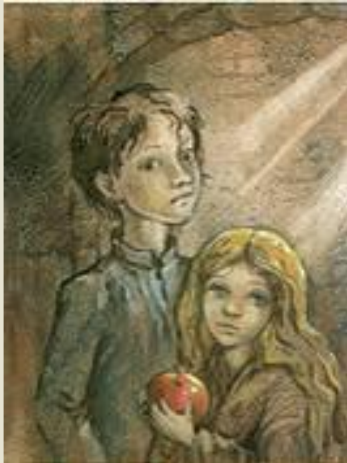
Валек и Маруся

В повести противопоставляются Маруся и Соня. Такое противопоставление называется антитезой. Маруся – худенькая маленькая девочка четырех лет.