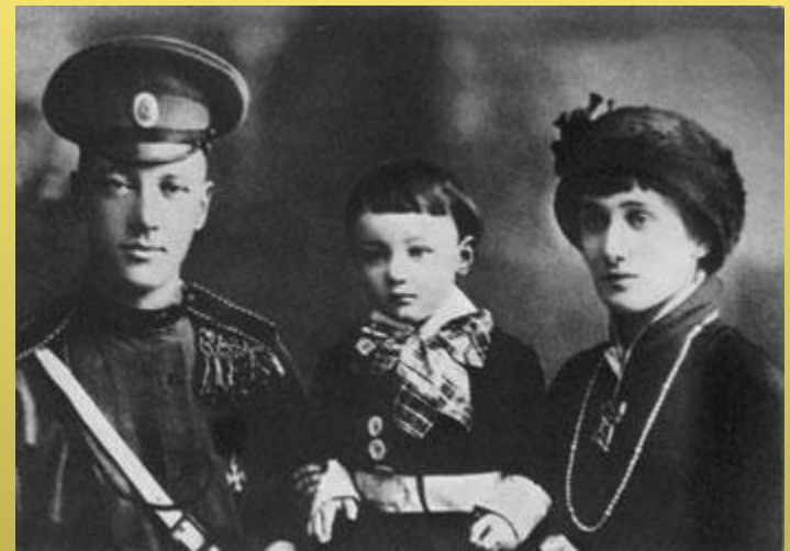
А.Ахматова и Н.Гумилев с сыном Львом.