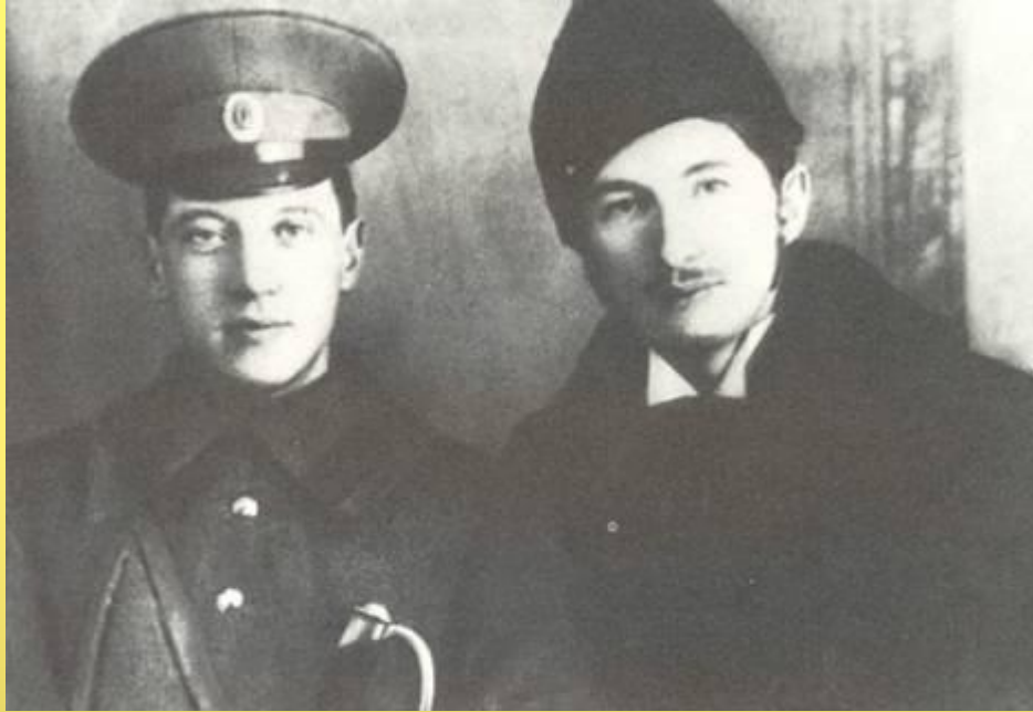
Николай Гумилев и Сергей Городецкий. 1915 г.

В 1911 году Гумилев, совместно с Сергеем Городецким, создает новую литературную группу - «Цех поэтов». В феврале 1912 г. В редакции «Аполлона» Гумилев заявил о рождении нового литературного течения, которому присвоили имя «акмеизм».