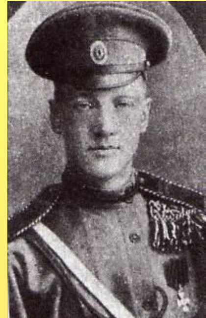
Н. С. Гумилев. Фотография. 1914г.

Молодой поэт твердо поставил перед собой цель – стать героем, смельчаком, выбирающим трудные и опасные пути, бросающим вызов всему миру. От природы робкий, физически слабый, он приказал себе стать сильным и решительным.