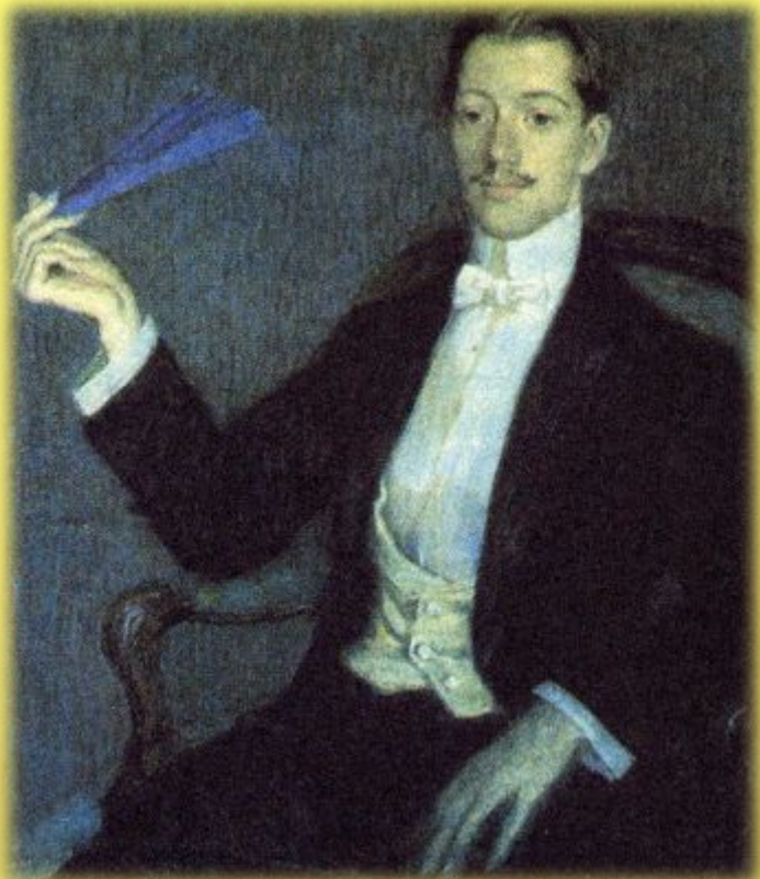
М. В. Фармаковский. Портрет Н.С. Гумилева. 1908г.

Поэзия «серебряного века» немыслима без имени Николая Степановича Гумилева (1886-1921). Создатель литературного течения акмеизм, он завоевал интерес читателей не только талантом, оригинальностью стихов, но и необычной судьбой, страстной любовью к путешествиям, которые