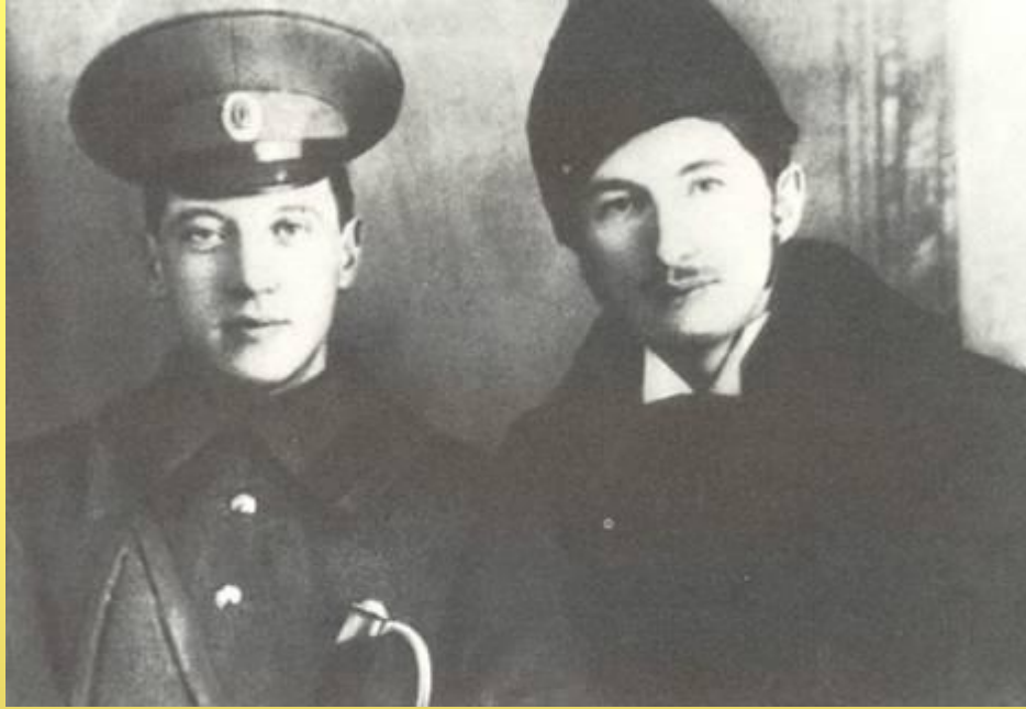
Николай Гумилев и Сергей Городецкий. 1915 г.

В 1911 году Гумилев, совместно с Сергеем Городецким, создает новую литературную группу - «Цех поэтов». В феврале 1912 г. В редакции «Аполлона» Гумилев заявил о рождении нового литературного течения, которому присвоили имя «акмеизм».