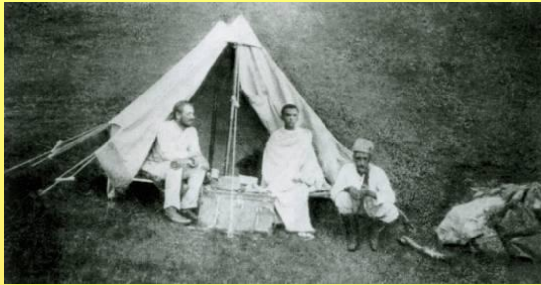
Гумилев в экспедиции в Африке.