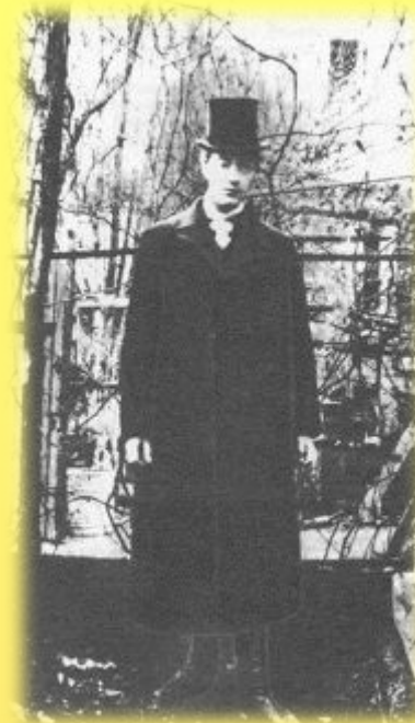
Н.Гумилев в Париже. 1908г.

С борник, изданный в Париже в 1908 году, Гумилев назвал «Романтические цветы» .