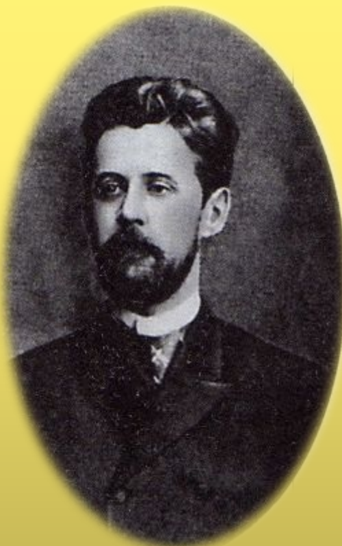
И.Ф. Анненский – директор и преподаватель Царскосельской гимназии