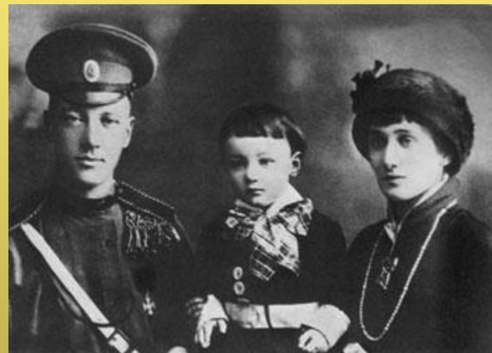
А.Ахматова и Н.Гумилев с сыном Львом.