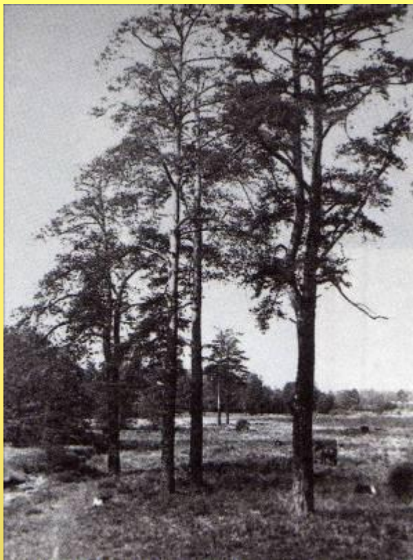
Место предполагаемого расстрела Н.С.Гумилева.