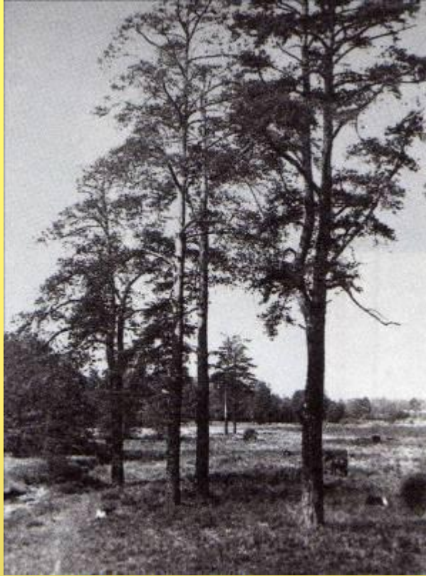
Место предполагаемого расстрела Н.С.Гумилева.