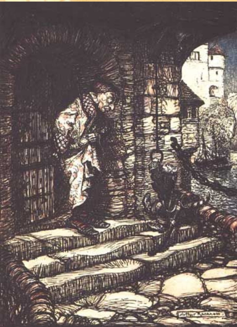
"Кот в сапогах"

Удивительно то, что все известные истории сборника «Сказки матушки Гусыни» были написаны вовсе не для детей. Их автор хотел доказать своим современникам, что сказки, которые рассказывают в народе, ничуть не меньше достойны внимания, чем возвышенные страсти древних греков и римлян.