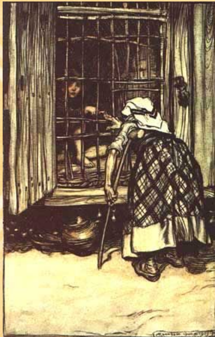
"Гензель и Гретель"

Злая мачеха почти погубила Белоснежку, ведьма заточила в башню без дверей Рапунцель. В страшном мире живут Гензель и Гретель. Семья голодает, мачеха заставляет отца избавиться от лишних ртов.