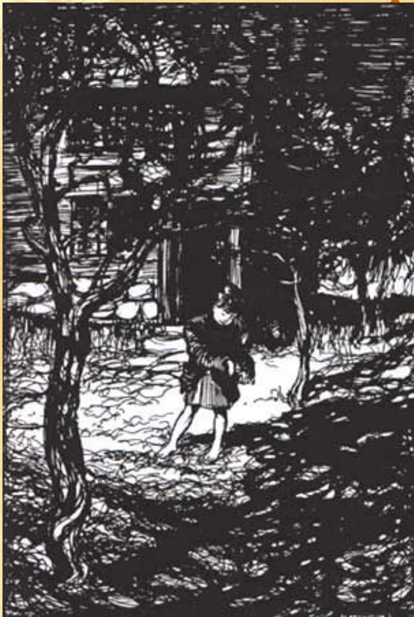
"Гензель и Гретель"

Птички склевывают крошки, по которым дети хотели найти дорогу домой. Но часто злодеи сами попадают в свои сети, а добрые герои торжествуют победу. Однако в сборнике сказок много и веселых историй. Тут и храбрый портняжка, который победил всех чертей, а испугался карасей, и знаменитые бременские музыканты. И многое, многое другое.