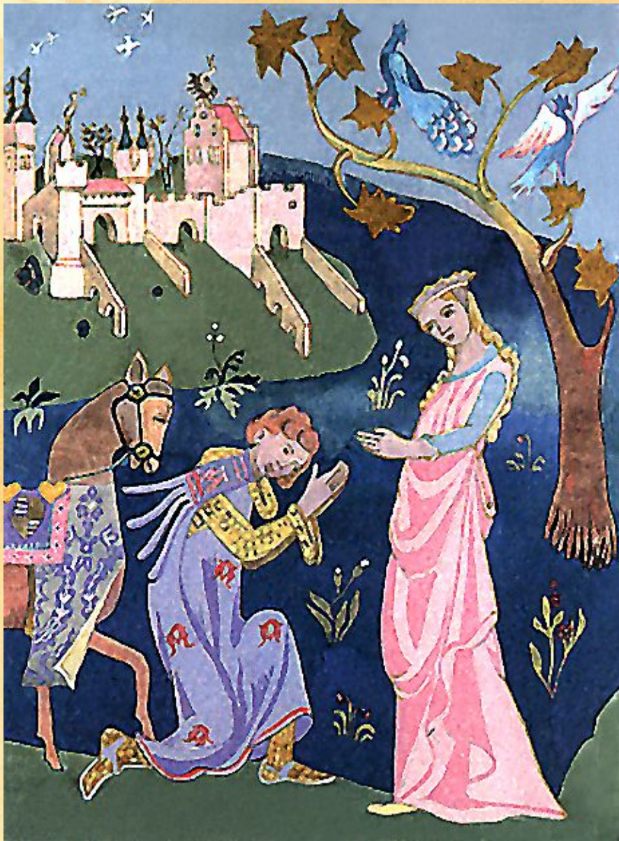
Сцена из сказки

Сказка по жанру является одним из видов эпических произведений.