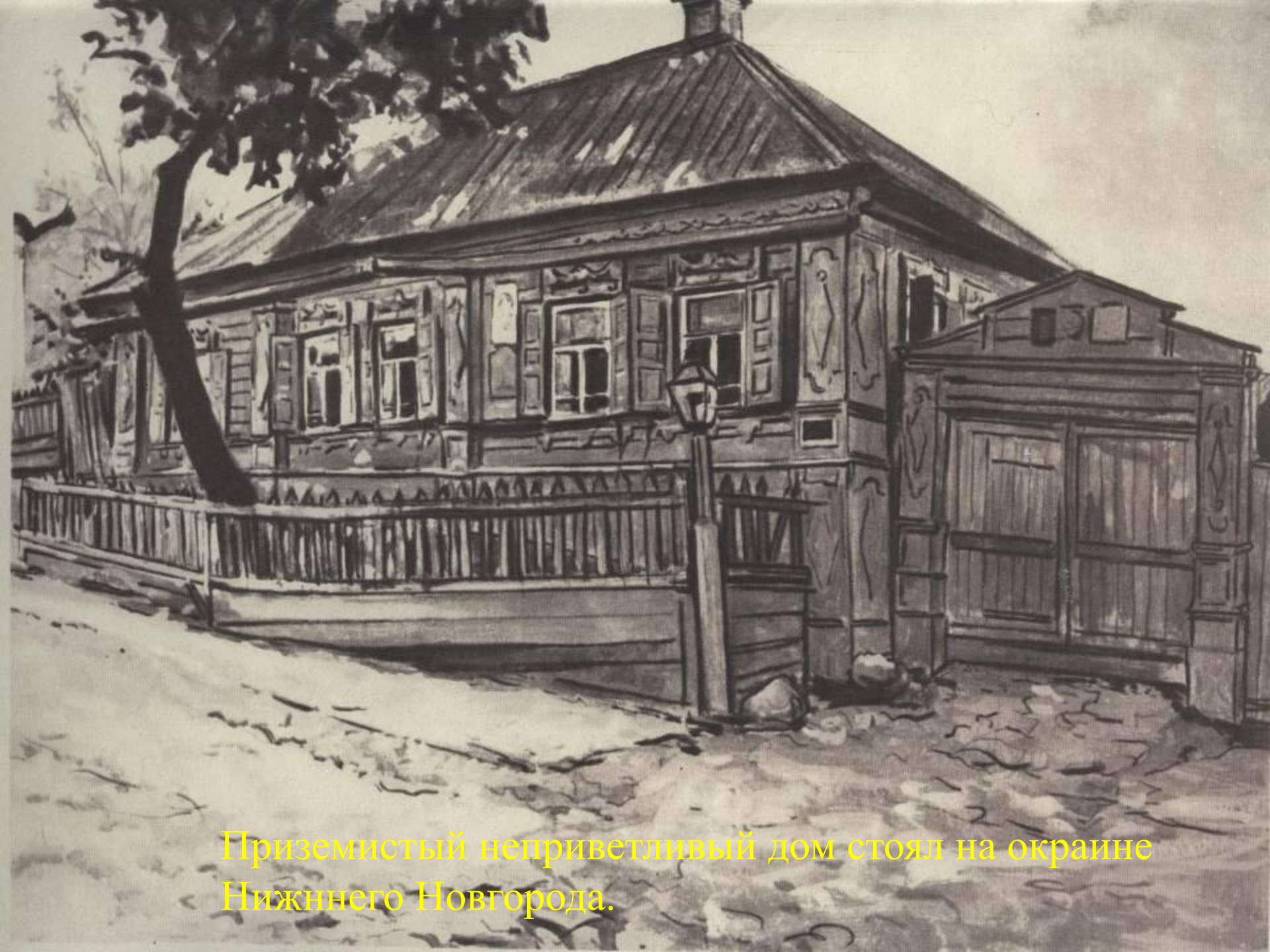
Приземистый неприветливый дом стоял на окраине Нижнего Новгорода.