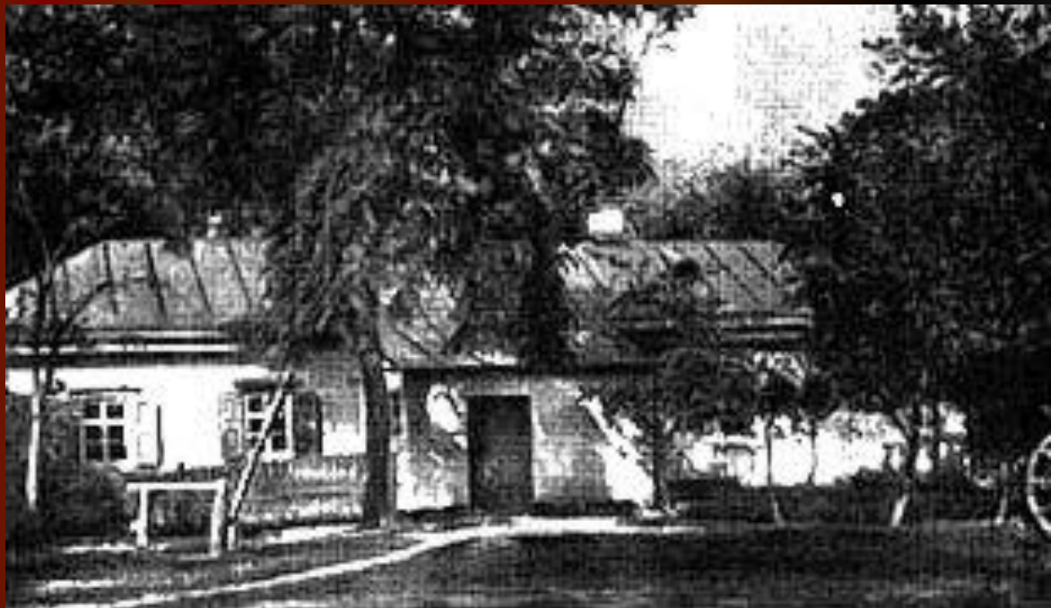
Дом доктора М.Я.Трохимовского в Сорочинцах, где родился Гоголь