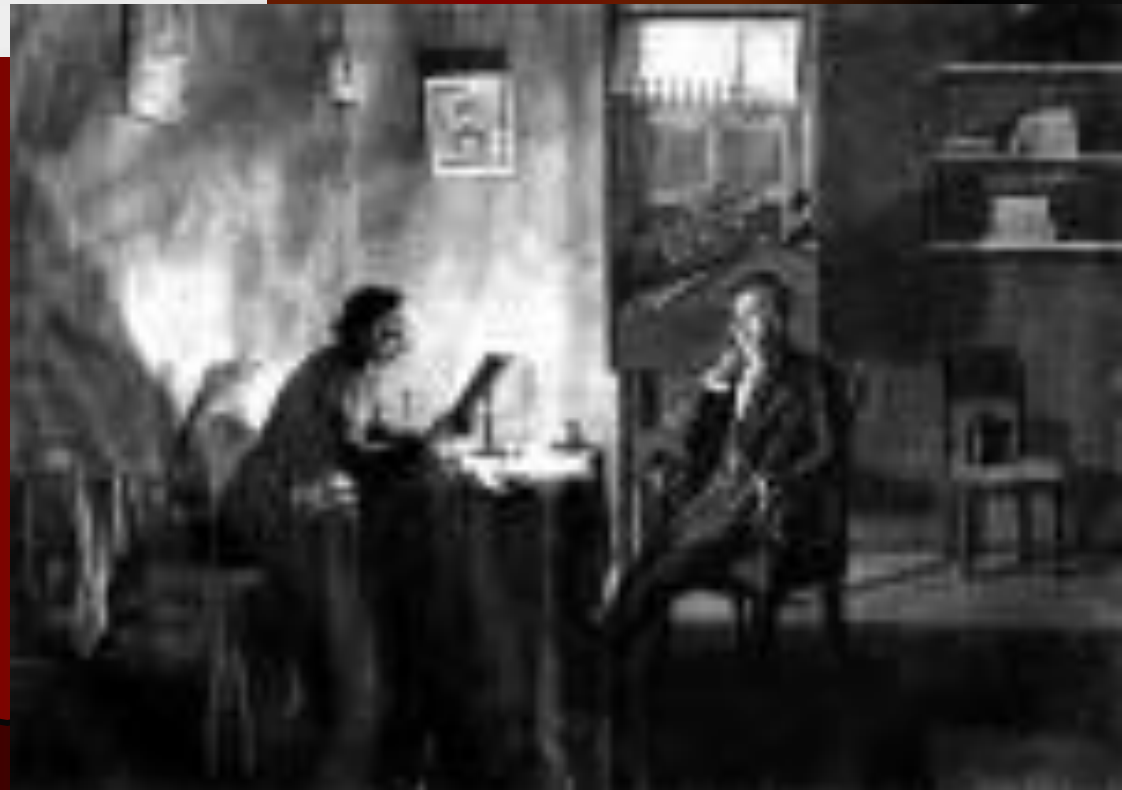
Пушкин у Гоголя