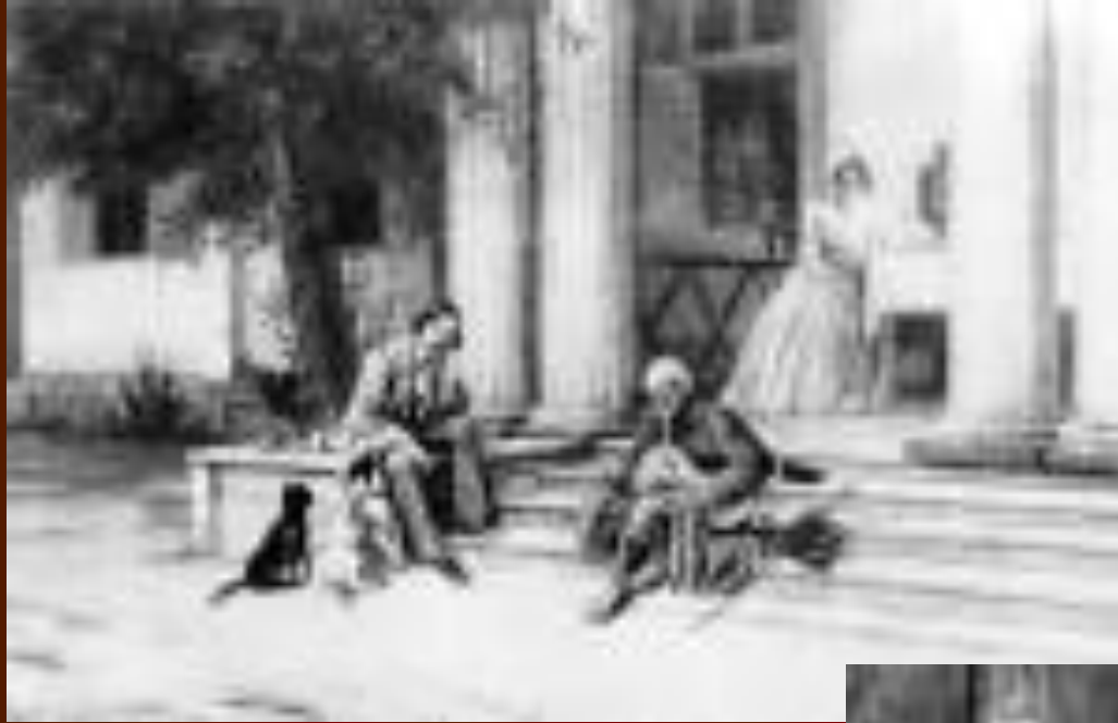
Н.В. Гоголь в Яновщине