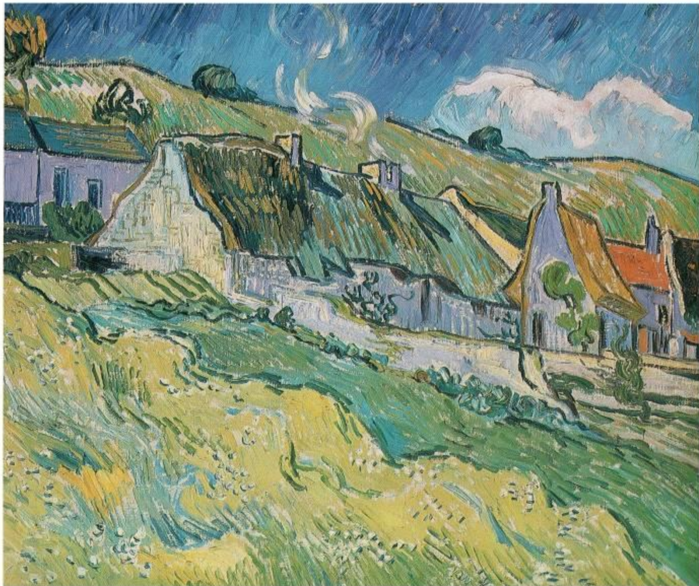
Винсент Ван Гог Голландия