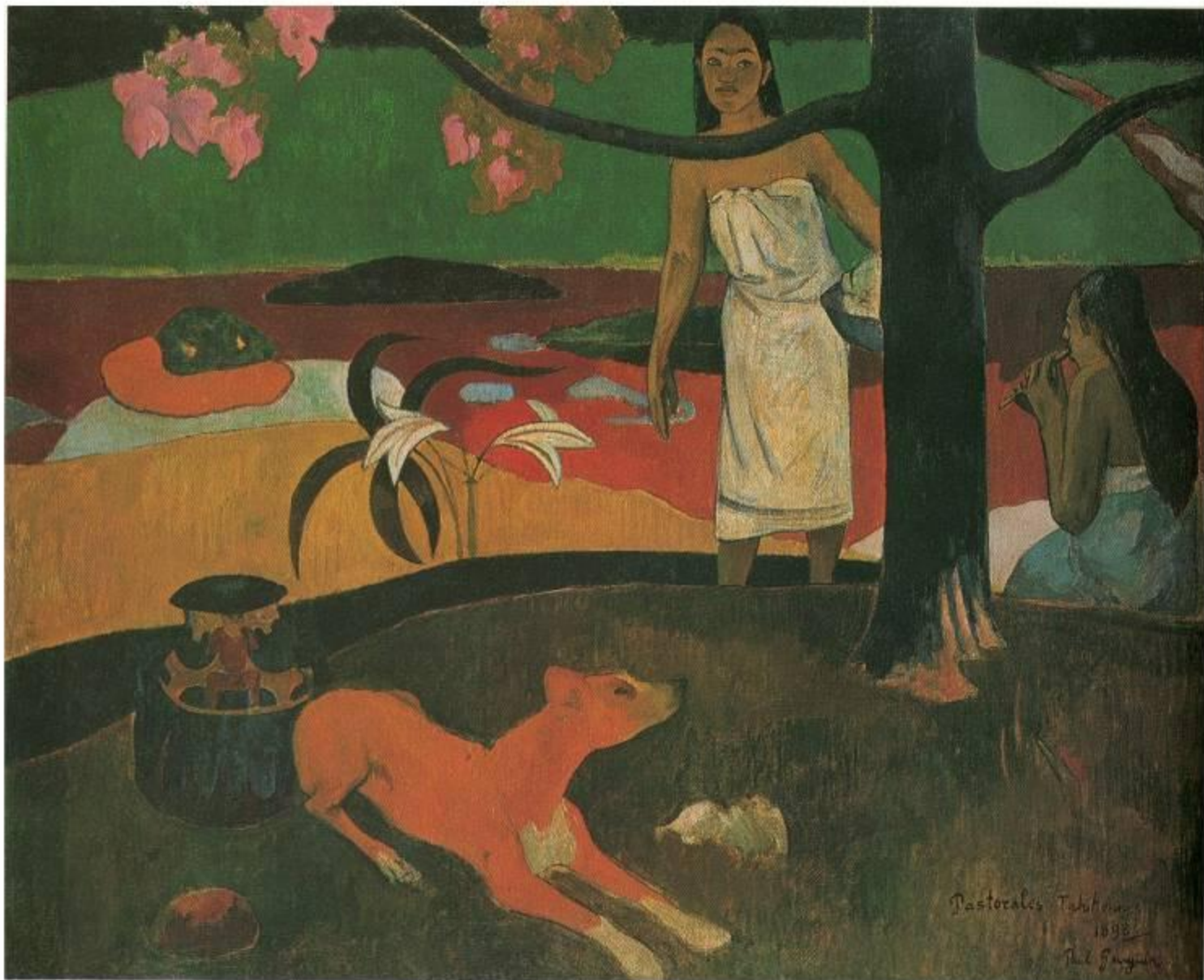
Поль Гоген Франция