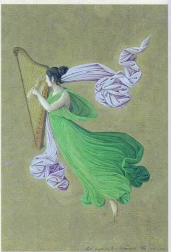
Ф. Толстой Муза

У Зевса и богини памяти Мнемозины было девять дочерей. Они приходились сводными сёстрами Аполлону и жили вместе с ним на Парнасе. Каждая покровительствовала какому-нибудь виду искусства или науки.