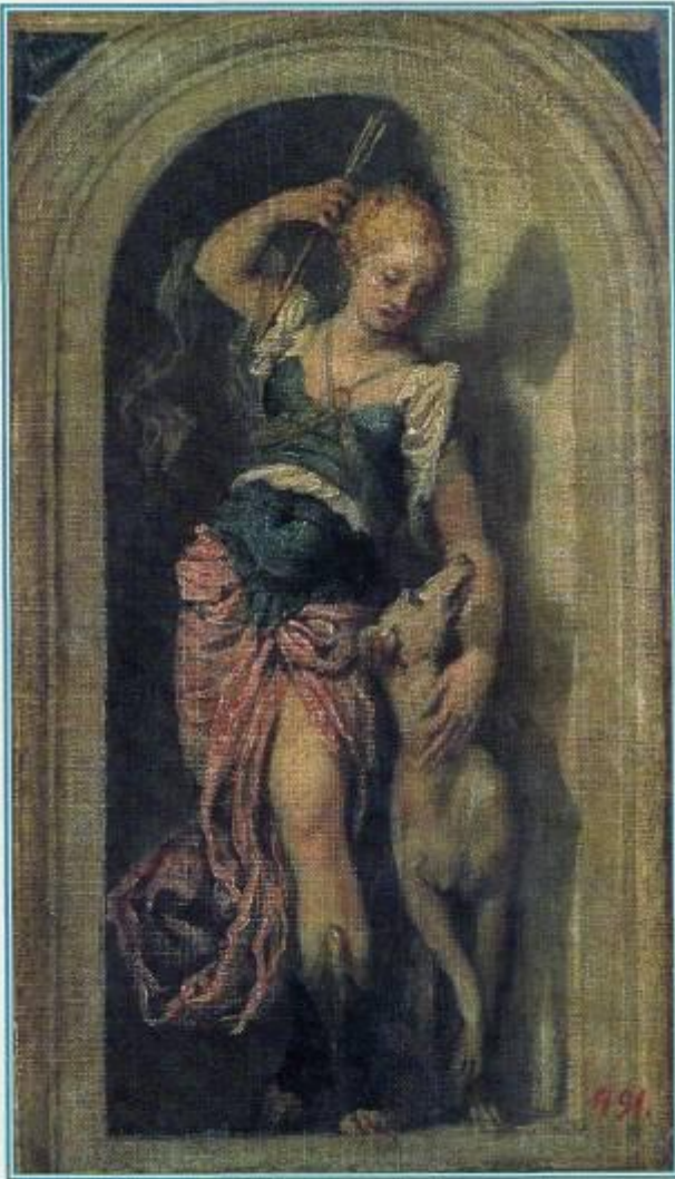
П. Веронезе Диана