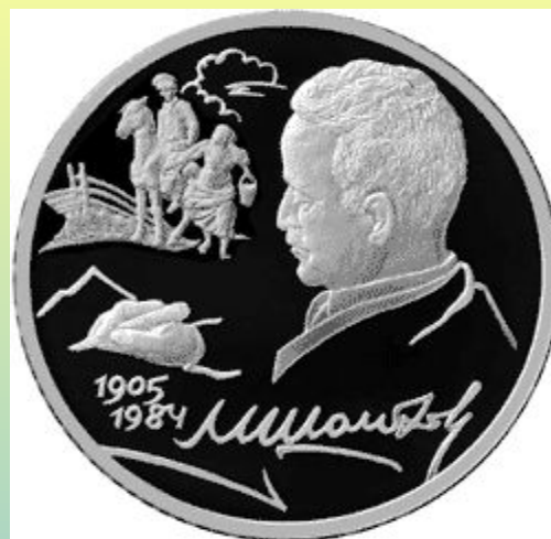
Монета с изображением Шолохова