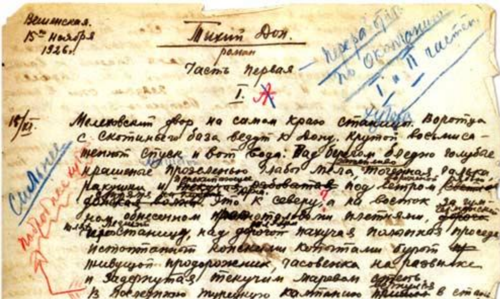
Верх первого листа черновика романа "Тихий Дон". Ныне рукопись найдена и хранится в ИМЛИ

Главный, наиболее известный роман Ш. «Тихий Дон» представляет собой эпическое повествование о первой мировой войне, революции, гражданской войне, об отношении к этим событиям казачества. Один из главных героев романа Григорий Мелехов – вспыльчивый, независимо мыслящий казак, храбро воевавший с немцами на фронтах первой мировой войны, а затем, после свержения самодержавия, оказавшийся перед необходимостью выбора, – сражается сначала на стороне белых, потом – на стороне красных и в конце концов оказывается в отряде «зеленых». После нескольких лет войны Григорий, подобно миллионам русских людей, оказался духовно опустошенным. Двойственность Мелехова, его противоречивость, душевные метания делают его одним из