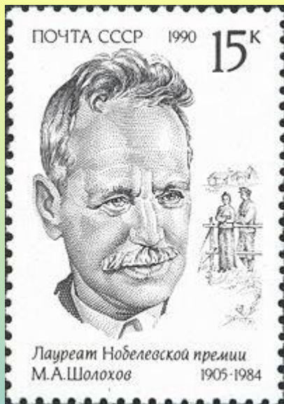
Марка СССР, 1990 г.