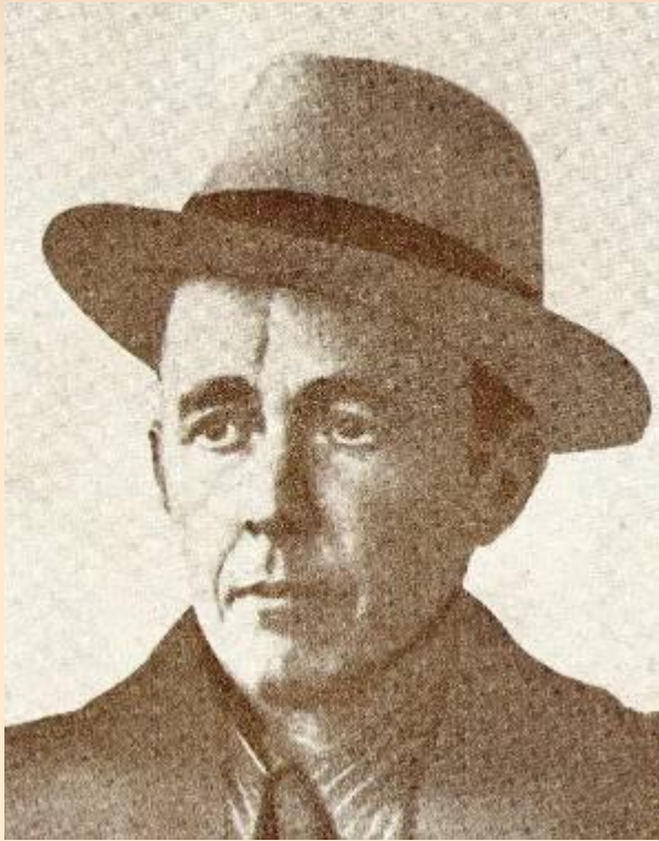
Солженицын после выписки из онкодиспансера

Сразу после освобождения у Солженицына обнаруживают страшную болезнь – рак. Приговор врачей – жить осталось не больше трех недель. Однако Солженицын не умер, излечился и осознал это как «божье чудо». Солженицын становится человеком религиозным.