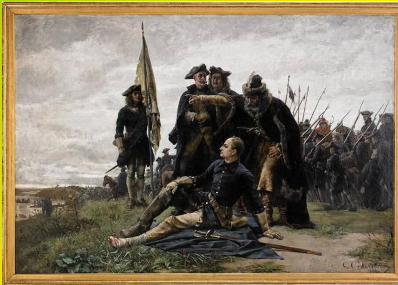
Карл XII и Мазепа после Полтавы на берегу