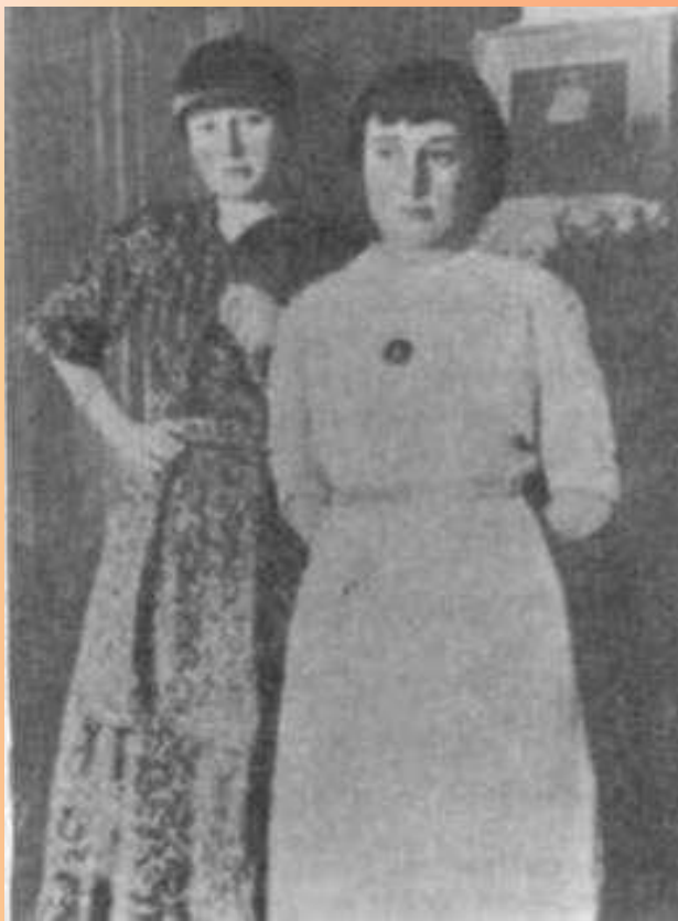
Анастасия и Марина Цветаевы

В 1909 году Марине и Асе было 17 и 15 лет. Они были как «крылья одной, летящей в небеса души». Сходство их и внешнее, и внутреннее было поражающим и восхищающим. Похожи были черты лица, прическа, голос... Может быть, волшебство двойного голоса при чтении сестрами в унисон стихов Марины было одной из причин первых успехов Марины Цветаевой в московских литературных кругах.