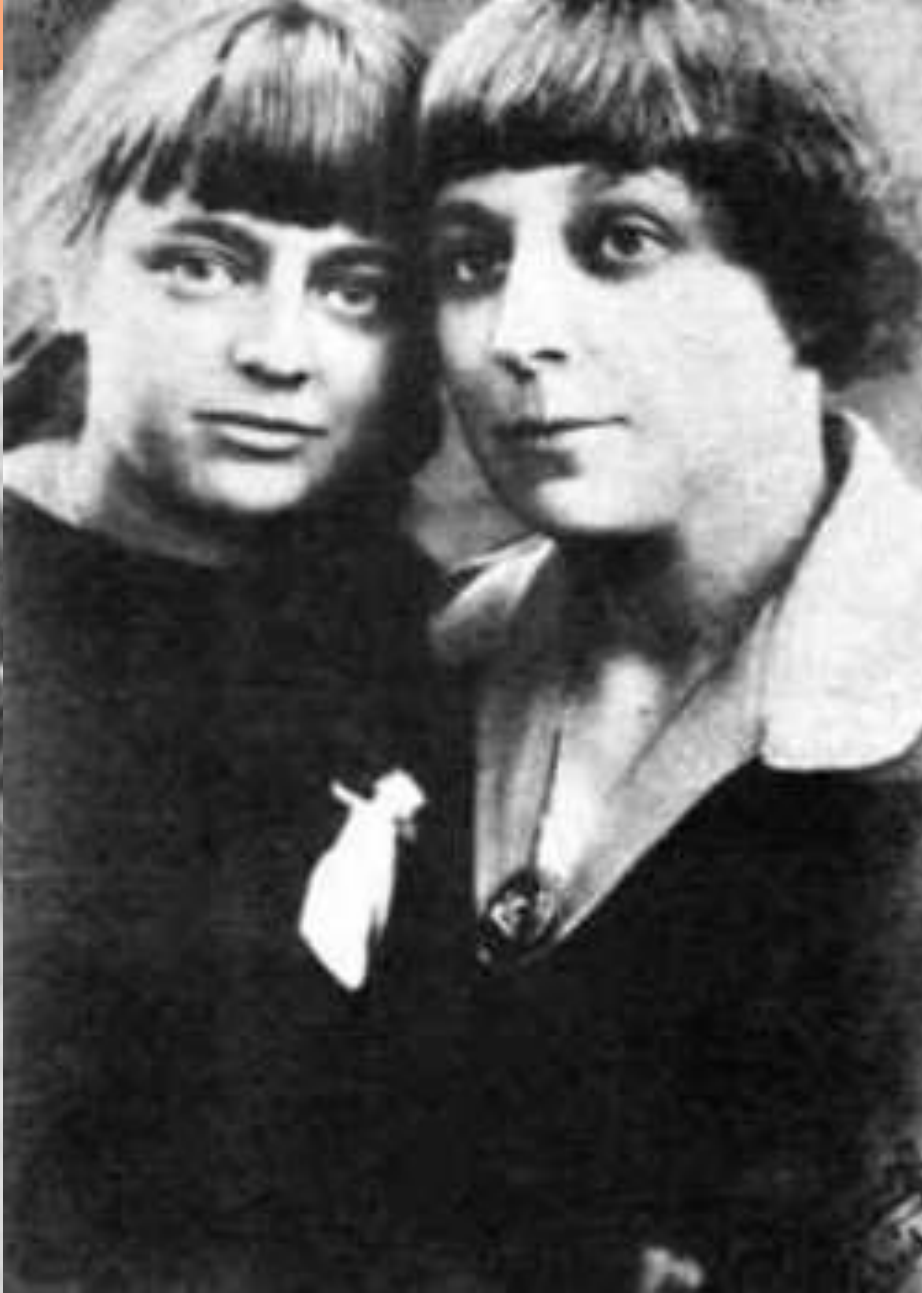
М. Цветаева с дочерью Ариадной.