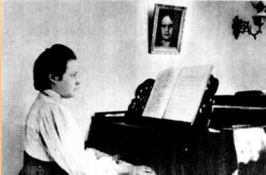
Марина Цветаева за роялем.