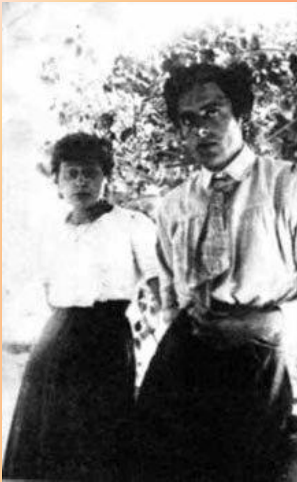
Марина Цветаева и Сергей Эфрон. Коктебель. 1911год

Кто создан из камня, кто создан из глины, -