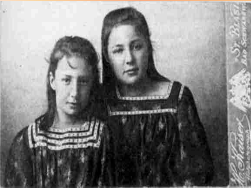
Анастасия и Марина Цветаева. 1905 год