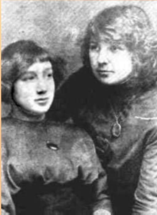
Анастасия и Марина Цветаевы

"Кто для Аси нужнее Марины? Милой Аsenьки кто мне нужней?" -