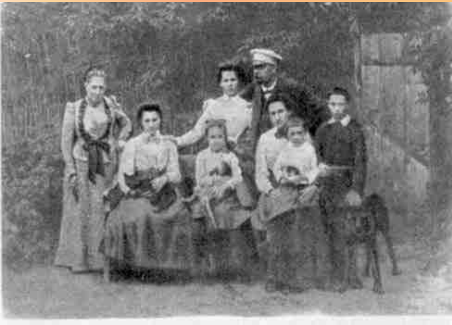
Семья Цветаевых во дворе дома в Трехпрудном. Стоят: Андрей, Иван Владимирович, Ольга Иловайская; сидят: Мария Александровна с дочерью Анастасией, Марина, Валерия.

• Ты, Дыи еиГрещеи на прабудны, Каждый дивилеи неицеи титот лаи иреиупои в руднои не вдалеке от ПаГрриаридеи вайпруда. Деи вайи и хобнейи сирасишдкя. не только переулук, но и его наи деи вайи сити вероидеи жеи в рудно Стеи аскои и в лавныйи в бравой измеи ено. Трехпрудный, потому чи и мовда-тпои каи Неи в вкднпри паГрриаридеи итосаи катреи и мевашм здесь редаи деи нцию, был не один пруд, а несколько.