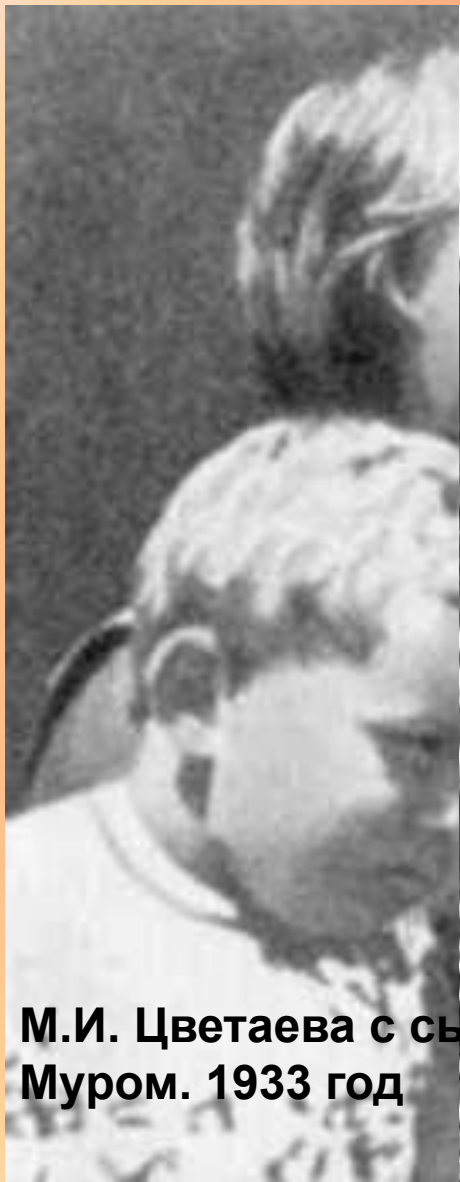
М.И. Цветаева с сыном Муром. 1933 год