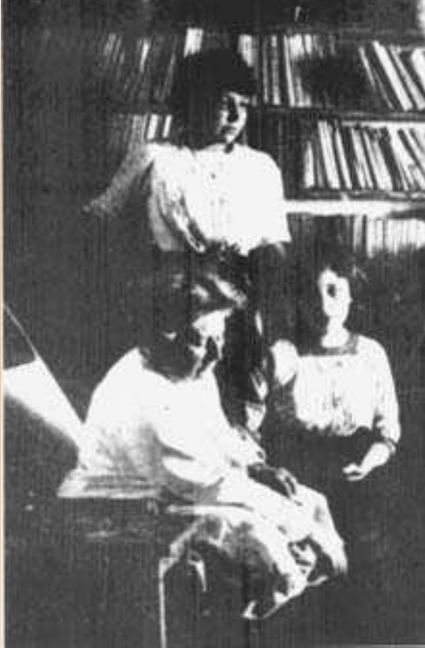
М. Цветаева. Коктебель. 1911 год