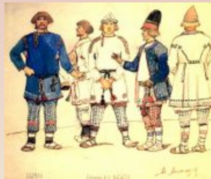
Брусила и берендеи ребята