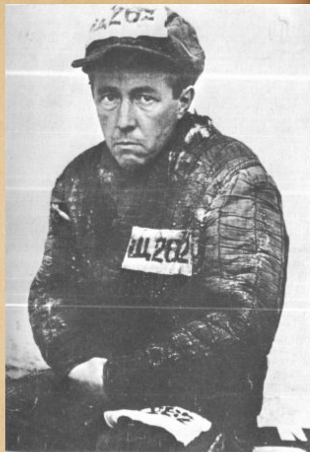
1. Особлаг (сразу по выходе), 1953 г.