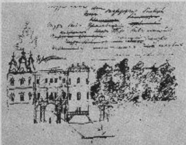
Литер Рисунок А. С. Пушкина из альбома «Воспоминания о лицейской жизни»