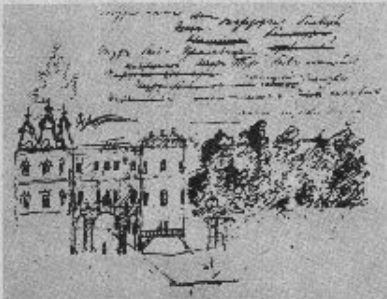
Литер Рисунок А. С. Пушкина из альбома «Воспоминания о лицее»