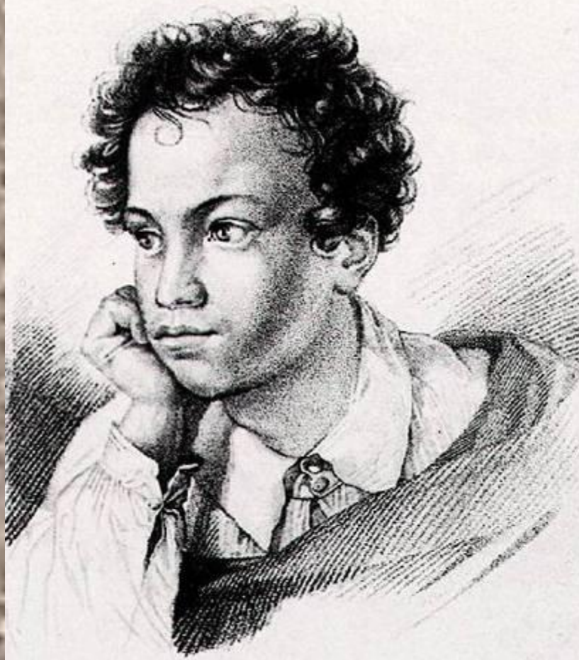
Е. И. Гейтман «Пушкин-юноша» /1822/