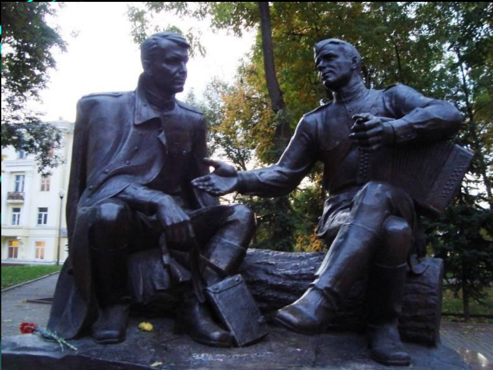
Памятник Твардовскому и Тёркину