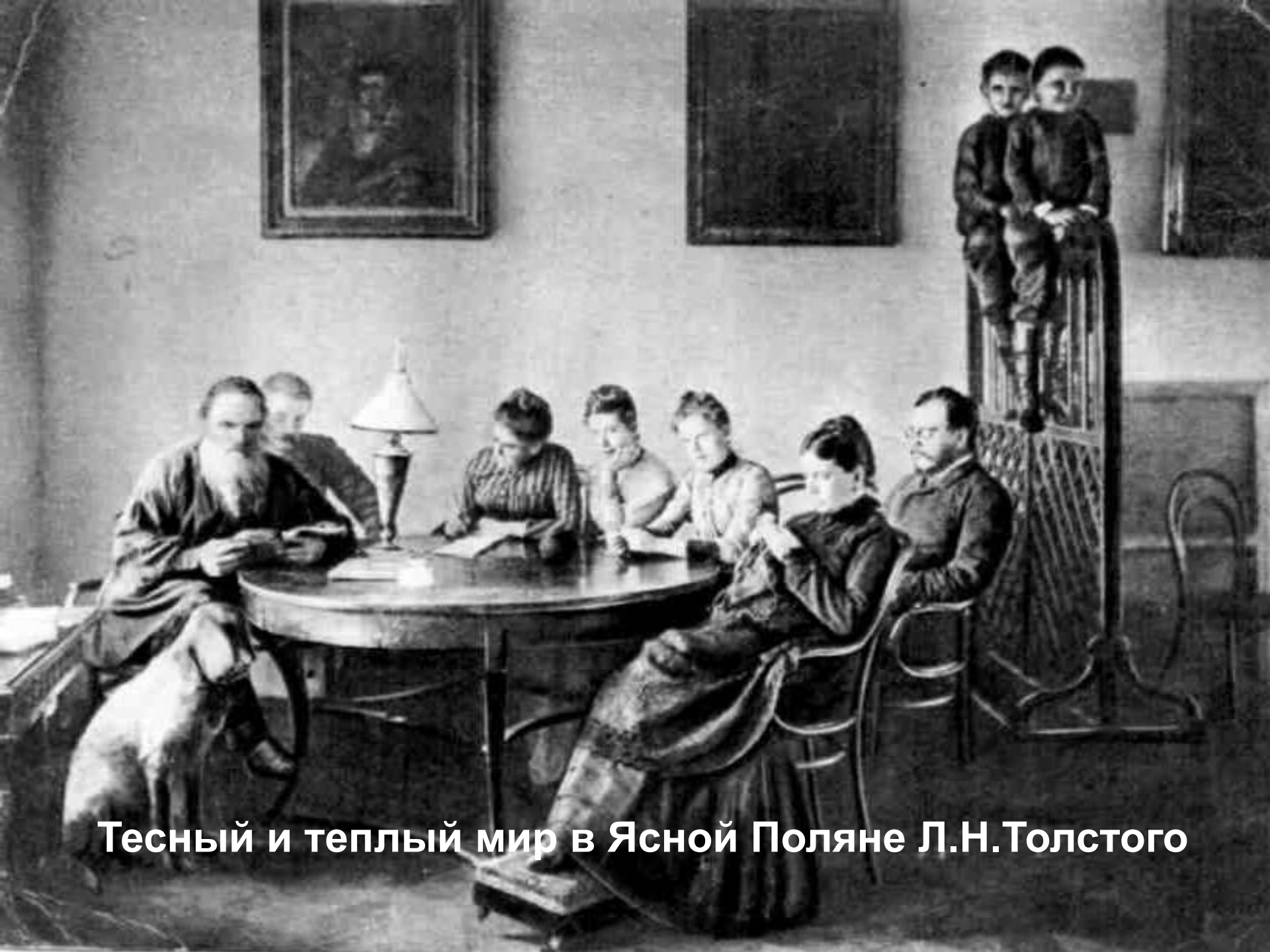
Тесный и теплый мир в Ясной Поляне Л.Н.Толстого